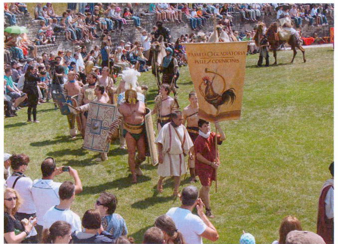
Abb. 1: Einzug der Gladiatoren anlässlich der Wiedereröffnung am 28. Mai 2011 (Foto W. Tschudin).