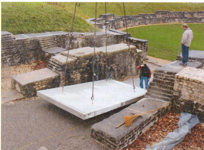
Abb. 1: Einbau der Betonrampe beim Eingang Ost.

Mit Unterstützung der Schweizerischen Eidgenossenschaft, dem Swisslos-Fonds des Kantons Aargau, der Gemeinde Windisch, der Stadt Brugg und der GPV konnte im Frühjahr 2011 von der Gesellschaft für Schweizerische Kunstgeschichte GSK der neue Kunstführer «Das Amphitheater Vindonissa Brugg-Windisch» veröffentlicht werden – ein Gemeinschaftswerk all jener, die an der Restaurierung beteiligt waren.