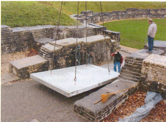
Abb. 1: Einbau der Betonrampe beim Eingang Ost (Foto T+U AG).

Mit Unterstützung der Schweizerischen Eidgenossenschaft, dem Swisslos-Fonds des Kantons Aargau, der Gemeinde Windisch, der Stadt Brugg und der GPV konnte im Frühjahr 2011 von der Gesellschaft für Schweizerische Kunstgeschichte GSK der neue Kunstführer «Das Amphitheater Vindonissa Brugg-Windisch» veröffentlicht werden – ein Gemeinschaftswerk all jener, die an der Restaurierung beteiligt waren.