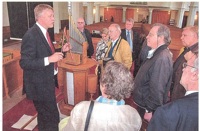
Abb. 2: Interessierte lassen sich nach der Feier die Wasserorgel erklären.