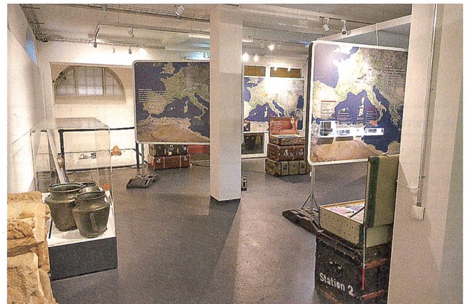
Abb. 1: Blick in die Sonderausstellung «Überall zu Hause und doch fremd, Römer unterwegs».