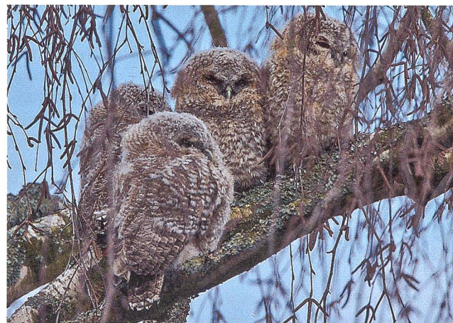
Abb. 1: Vier Jungvögel im Amphitheater.

Dass sich die Parkanlage als wertvolle ökologische Ausgleichsfläche im dichten Siedlungsgebiet bewährt, hat sich diesen Frühling gezeigt. Waldkauze leben normalerweise in Wäldern oder grossen Parkanlagen, seltener in Siedlungsgebieten. Im Amphitheater hat nun ein Waldkauz-Paar erfolgreich vier Jungvögel aufgezogen, dies trotz der nasskalten Witterung in den Monaten Februar und März. Gegen Ende März sass die Jungvögel – in diesem Alter auch Ästlinge genannt – in den Bäumen rund um's Amphitheater und bettelten abends lautstark um Futter. Diese erfreuliche Vogelfamilie wurde von vielen Anwohnern im Quartier bemerkt und die Käuze waren in dieser Zeit die Attraktion im Quartier. Mit zunehmendem Alter entfernten sich die Jungvögel immer weiter von ihrer «Kinderstue-