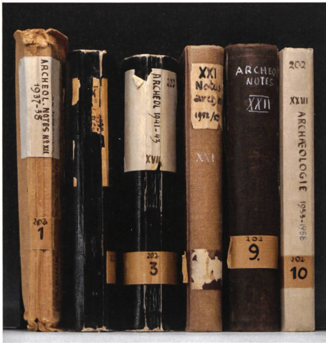
Abb. 6: Die Tagebücher von August Gansser-Burckhardt sind in gutem Zustand. Nur eines ist restaurierungsbedürftig.