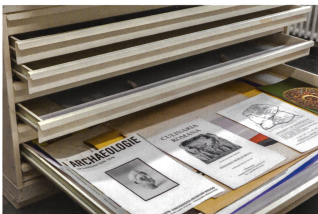
Abb. 3: Der Planschrank im Archivraum.