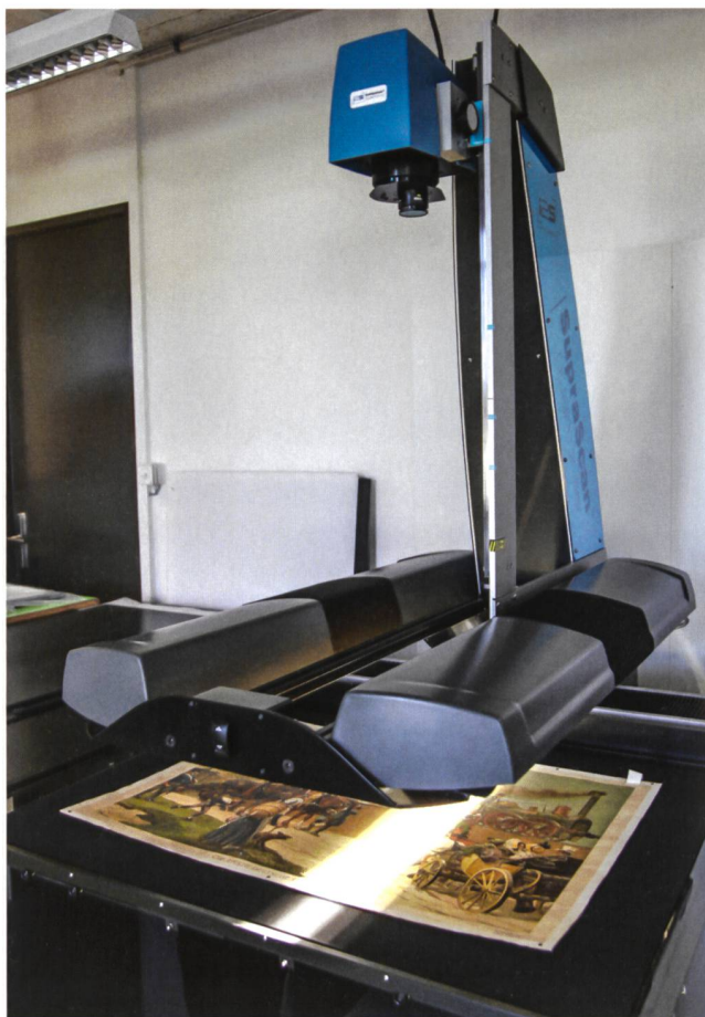
Abb. 5: Mikroverfilmung von Dokumenten mit Scannern in der Mikrografie Basel. (Beispielbild; das Dokument stammt nicht aus dem Archivbestand der GPV.)

Im Winter 2014 begann an einem Februartag die Verfilmung der ersten Etappe durch die Mikrografie Basel. Akteninhalt dieser ersten Etappe waren alle Planmappen, eine Schachtel mit einzeln verzeichneten Vereinbarungen und alle Findmittel. Die Aktion war im April mit der Rückgabe der Akten von Basel nach Brugg beendet. Ein Film gelangte nach Aarau zur Denkmalpflege, ein zweiter nach Heimiswil BE in das Mikrofilmdepot der Eidgenossenschaft. Die zweite (von insgesamt vier vorgesehenen) Etappen wurde 2015 durchgeführt, Inhalt waren ein Teil der Behältnisse mit den Dossiers. Die dritte Etappe sollte bei Gelegenheit vorgenommen werden können und soll den zweiten Teil der Behältnisse mit Dossiers umfassen. Die vierte Etappe wird die bisher noch unerschlossenen Bestände der aktiven Ablage beinhalten.