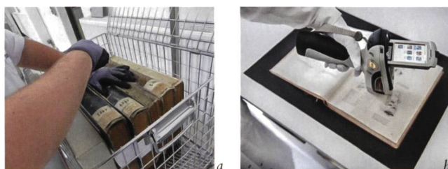
Abb. 4: Bearbeitungsschritte bei der Papierentsäuerung: Schriftdokumente in Körben platzieren (a), nach der Behandlung Qualitätstest mithilfe der Röntgenfluoreszenzanalyse (b).

Zum Papersave-Verfahren, wie es die Firma Nitrochemie Papersave anwendet, kann noch bemerkt werden, dass es eines der technologisch am besten entwickelten nichtwässrigen Verfahren zur Massenentsäuerung darstellt. Es hält die DIN-Empfehlung 11 zur Bestandserhaltung ein. Seit 20 Jahren ist die Methode internationale Praxis. Bei einer Entsäuerung und anschliessend sachge-