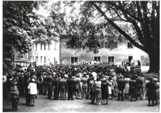
Abb. 7: Die Jubiläumsfeier zum 50-jährigen Bestehen der Gesellschaft Pro Vindonissa am 1. Juni 1947. Bundesrat Philipp Etter unter den geladenen Gästen (Mitte, Fuss abstützend) im Steingarten des Vindonissa Museums (a). Zahlreiche Gäste fanden sich zur Jubiläumsfeier in Königsfelden ein (b).

Arbeitsdienstes der 1930er-Jahre, die dem Kanton zur Orientierung zukamen. In den 1980er-Jahren wurde ein Kulturgüterschutzraum auch für Kulturgüter des Vindonissa Museums bewilligt. Auch Druckkostenbeiträge für Monografien wurden bewilligt.