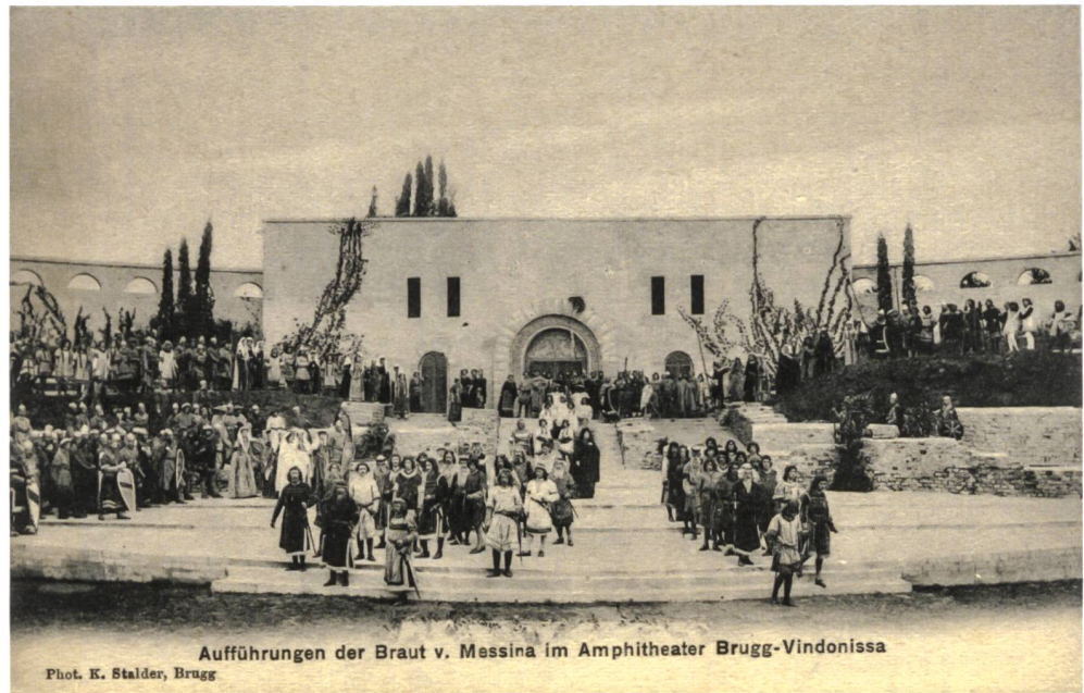
Abb. 10: Aufführung «Die Braut von Messina» von Friedrich Schiller im Amphitheater in Windisch im Jahr 1907.

die architektonische Geschlossenheit mache das Amphitheater zur schönsten aller römischen Anlagen, die in der Schweiz besucht werden können. Es sei darauf geachtet worden, dass es eine Stätte der Belehrung und Betrachtung bleibe. Sanierungen am Amphitheater waren durch die Jahrzehnte hindurch vonnöten, die man weitgehend vornahm. So war 1966 eine Sanierung des Mauerwerks nötig. In den 1970er-Jahren war Architekt Ernst Bossert derjenige, der die eidgenössischen Bundesstellen kontaktierte. Man betonte nach 1990 die nationale Bedeutung des Amphitheaters und die Schlüsselrolle der Bundesstellen. Ein Bericht anerkennt das Vorhandensein des originalen römischen Mauerwerks, verbunden mit späteren Ergänzungen. Von den 1990er-Jahren an wurde wegen Mauerzerfalls eine Baugrundsaniierung nötig. Der Regen unterspülte die Mauern und man befürchtete, die Pappeln könnten das Mauerwerk zerstören. Das Ruinenmauerwerk wurde deshalb vollständig saniert, und ein Entwässerungskonzept wurde erstellt. Es wurde von «unumgänglichen, umfangreicheren Rettungsmassnahmen» gesprochen. Man erstellte damals ein Nutzungs- und Erhaltungskonzept. Vorhanden ist schliesslich die Projektdokumentation der Restaurierung des Mauerwerks im Jahr 2005.