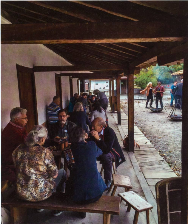
Abb. 7: Am Samstagmittag, zwischen Kolloquium und Jahresversamm- lung, wurden die Teilnehmerinnen und Teilnehmer auf dem Legionärspfad gestärkt und gepflegt.

datenmahl bei den Contubernien des Legionärspfad zubereitet (Abb. 7). Dies gab Gelegenheit für eine kurze Verschnaufpause zwischen den zum Teil hitzigen Diskus- sionen des Kolloquiums und der Jahresversammlung. Die bemerkenswert hohe Teilnehmerzahl und die an- geregten Diskussionen haben das nach wie vor grosse Interesse der Forschungswelt, aber auch der Laien für den Fundplatz Vindonissa aufgezeigt. Dies ermutigt uns, in Zukunft weitere vergleichbare Veranstaltungen zu pla- nen und durchzuführen. 2022 wird die Gesellschaft Pro Vindonissa 125 Jahre alt, das nächste Jubiläum steht also schon fest!