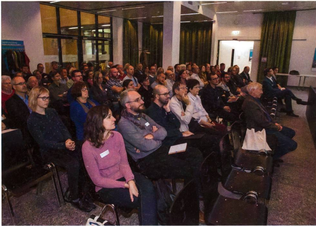
Abb. 2: Das Kolloquium am 20./21. Oktober 2017 zog viele Hörerinnen und Hörer an.

von Vindonissa 6 . Im Zentrum des Vortrages stand die Diskussion der Befunde, welche mit der Ankunft der 13. Legion in Vindonissa in Zusammenhang gebracht werden können.