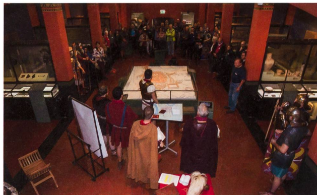
Abb. 6: Mit einem einstudierten Stück zeigt die Reenactmentgruppe VITA ROMANA, wie sich vielleicht die «Gründung» des Legionslagers abgepielt haben könnte.