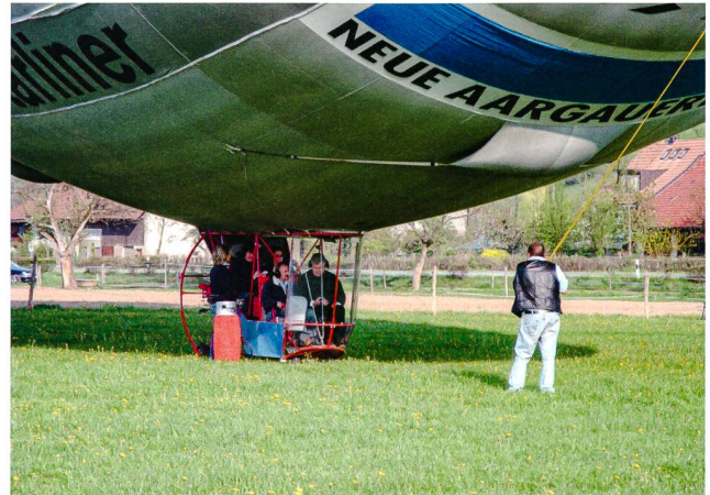
Abb. 2: Start des Zeppelins zum Flug über Vindonissa