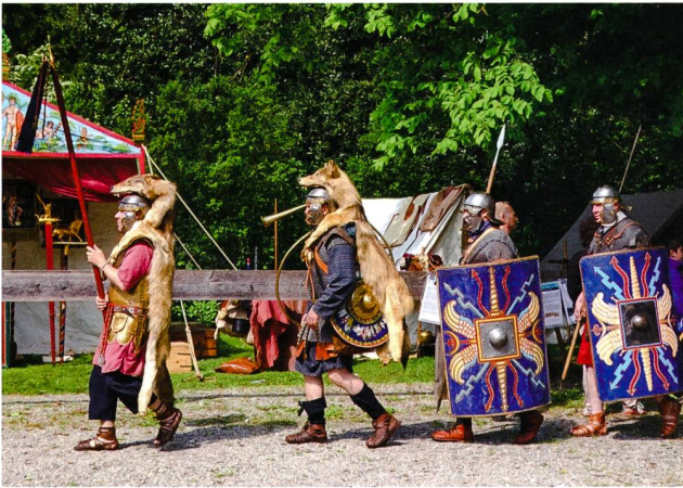
Abb. 1: Römertage mit unvergesslichen Momenten!