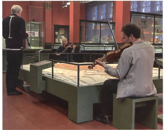
Abb. 5: Die Musiker:innen der Live-Klangperformance «I am not alone» beim Bespielen des Vindonissa Museum.