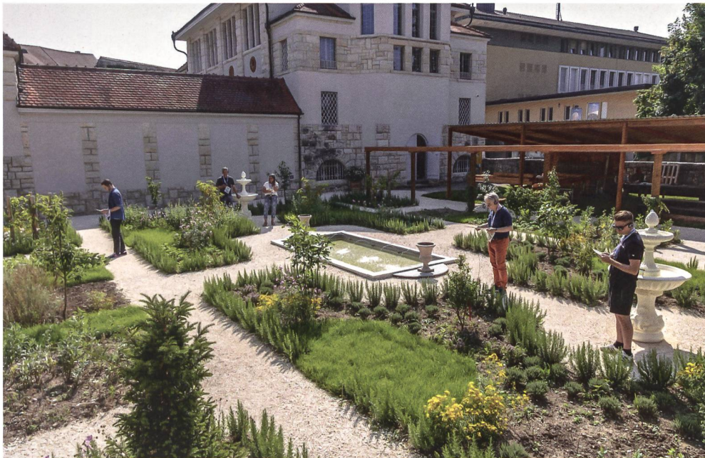
Abb.2: Der römische Garten im Vindonissa Museum.