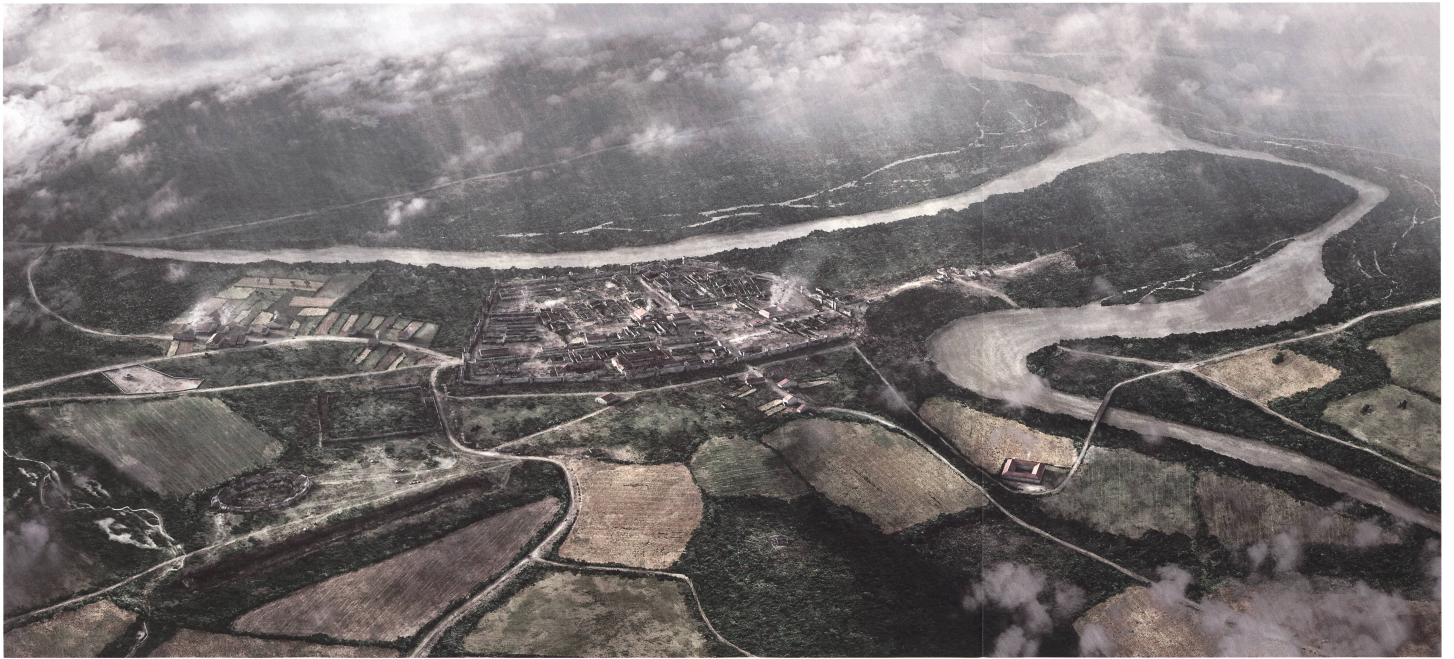
Beilage 3: Ein »Lebensbild« des römischen Vindonissa im frühen 3. Jahrhundert n. Chr., Blick von Süden, Forschungsstand 2021 (Kantonarchäologie Aargau/Romanat GmbH, Duggli).