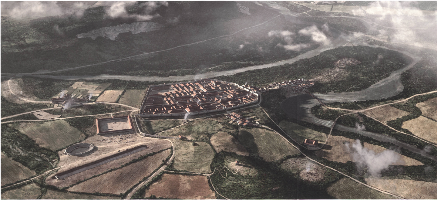
Beilage 2: Ein «Lebensbild» des römischen Vindonissa mit Lageranlagelager und Zivilsiedlung im späten 1. Jahrhundert n. Chr., Blick von Süden, Forschungsstand 2021 (Kartenschematische Angaben/ikonisierte Gebäude, Brugg).