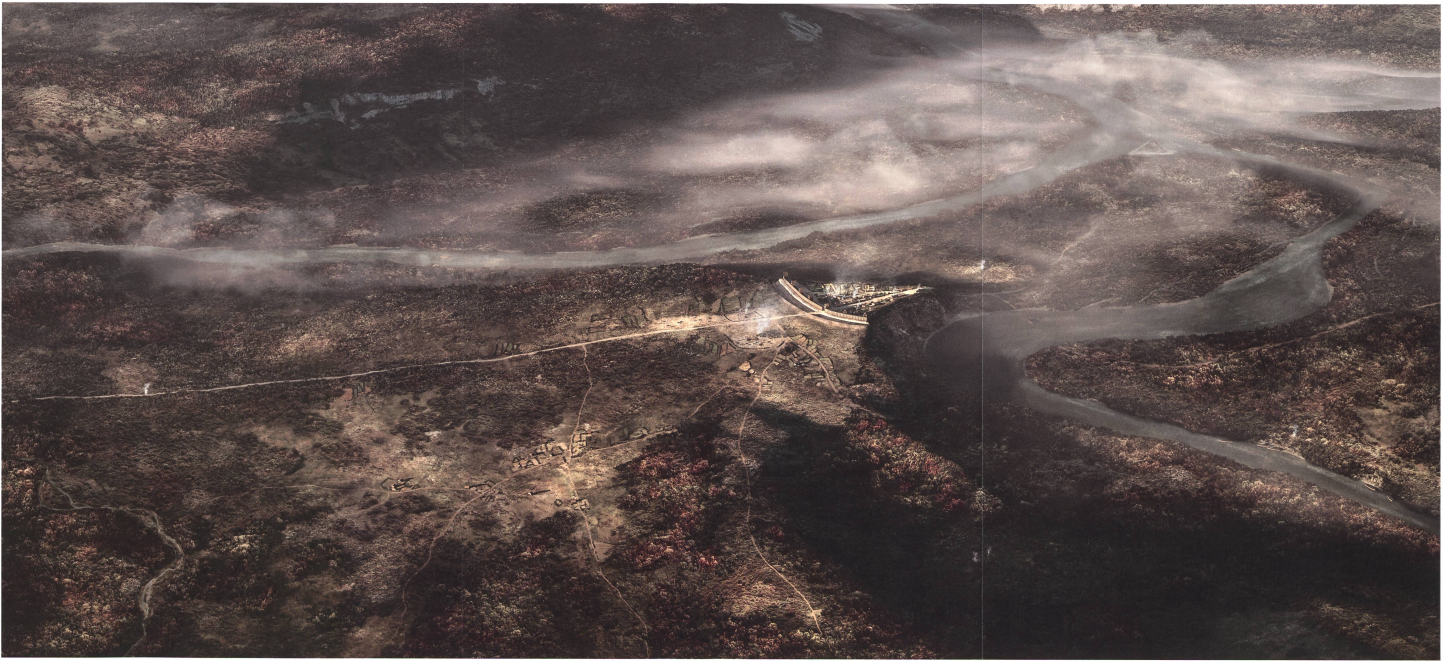
Beilage 1: Ein «Lebensbild» des keltischen Vindonissa im 1. Jahrhundert v. Chr., Blick von Süden, Forschungsstand 2021 (Kartographische-Anlagen/Institut GmbH, Brugg).