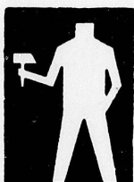
Konfessionelle und gelbe Verbände

Die zweite Darstellung bezieht sich auf die Mitglieder der V. S. A. ( 2\frac{1}{2} ) und auf den Föderativverband ( \frac{1}{2} ).