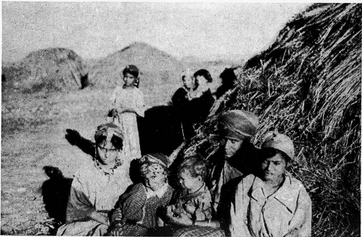
Die Witwe Golai mit ihren vier Kindern; im Hintergrund einige Gourbis

Das Elend der algerischen Flüchtlinge ist riesengroß und ohne Beispiel in der so «reichen» Geschichte der europäischen Flüchtlingsströme. Die rassisch und politisch Verfolgten der faschistischen und nazistischen Systeme in Zentral- und Südeuropa, in Italien, Oesterreich, Deutschland und selbst in Spanien waren sicher unglücklich genug und bedurften unserer Hilfe. Aber wenn sie ihre Heimat verlassen mußten, konnten sie sich doch meist in ein Land begeben, in dem wirtschaftlich geordnete Verhältnisse herrschten, und sie waren in jedem einzelnen Falle auch nicht annähernd so