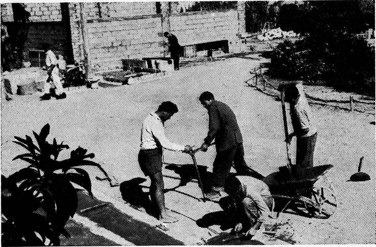
Flüchtlinge bauen das Heim für Flüchtlingskinder des Schweizerischen Arbeiterhilfswerks in La Marsa