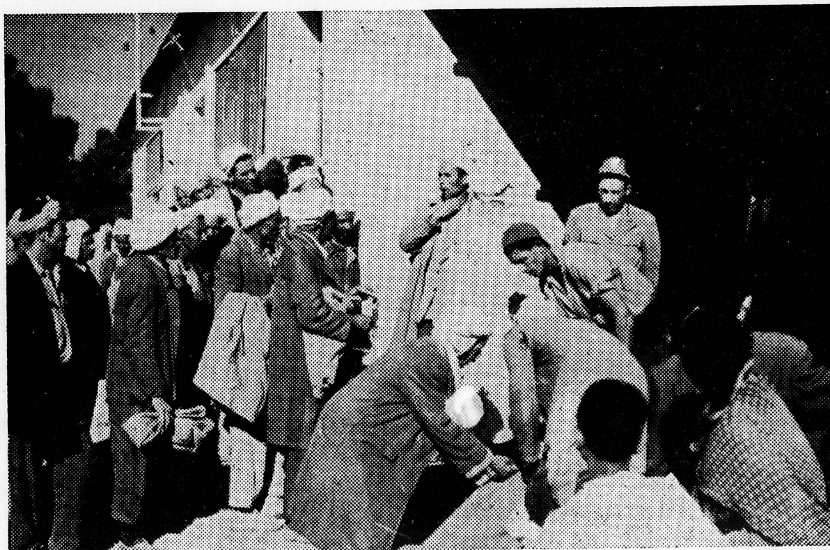
Die Getreideverteilung in Touiref

Als ich auf Arabisch «danke» stammelte, huschte der Schatten eines Lächelns über einige Gesichter.