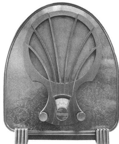
Le Philips 830A (1932), dit «boîte à jambon».