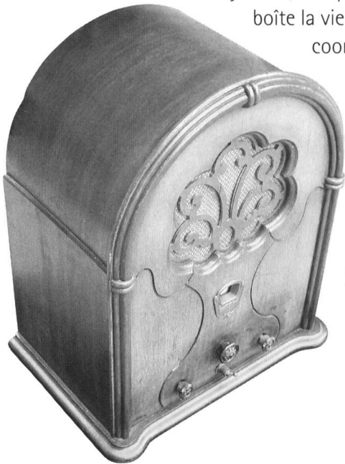
Regent Super (vers 1930). Appareil «cathédrale» à ondes moyennes de fabrication américaine.

Ce jour-là, n'importe qui pourra mettre en boîte la vie qui passe, dans toutes ses coordonnées réelles, aussi facilement qu'aujourd'hui il prend des notes avec son stylo. Et il se peut qu'alors l'historien en vienne à considérer que son principal matériau est l'image sonore et non plus le mot écrit» 10 .