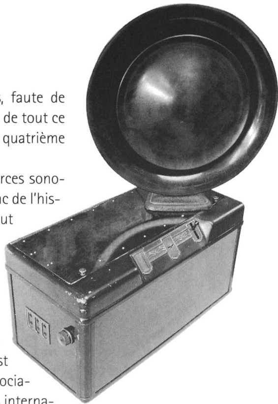
Philips 2511 (1929). Un appareil assez répandu en Suisse malgré son prix, relativement élevé pour l'époque (750 francs).

Enfin la chanson , un des thèmes centraux de cette livraison et du CD qui l'accompagne. Mieux que tout autre document peut-être, la chanson reflète, exprime et