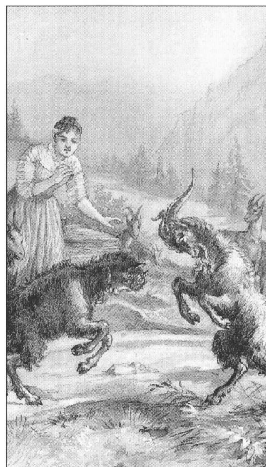
Les chevriers. Illustration de Joseph Reichlen pour La Gruyère Illustrée , 3 e livraison, 1892.

Selon lui, le patois est, la langue «de la population rude et inculte». Tout Fribourgeois – lettré – doit se «débarbouiller» du mieux qu'il pourra de ces traces de patois qui entravent ses progrès dans la maîtrise du français classique. Le patois doit être relégué au rang de relique , un de ces objets d'étude de l'Histoire: «il n'en est pas moins intéressant de l'étudier» reconnaît-il, «non pour en faire un instrument de la pensée, mais pour remonter par la reconnaissance des étimologies ( sic ) à celles des peuples dont nous descendons ou avec lesquels nous avons des relations fréquentes.» D'autre part, selon lui, le patois est incompréhensible. Or, rappelle-t-il, la fonction de la littérature est d'être lue: «Mais qui peut lire des choses qu'on a mille peines à déchiffrer?»