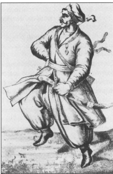
Cosaques zaporogues, détails d'une aquarelle de la fin du XVIII e siècle.