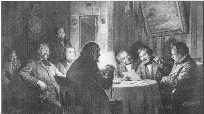
Gogol lisant des extraits de son ouvrage, Le Revizor .

(d'après: DE WECK, Anne-Sibylle: Un mouvement migratoire insoupçonné: les Fribourgeois en Europe centrale et orientale (1860-1914) . Fribourg, 1998.