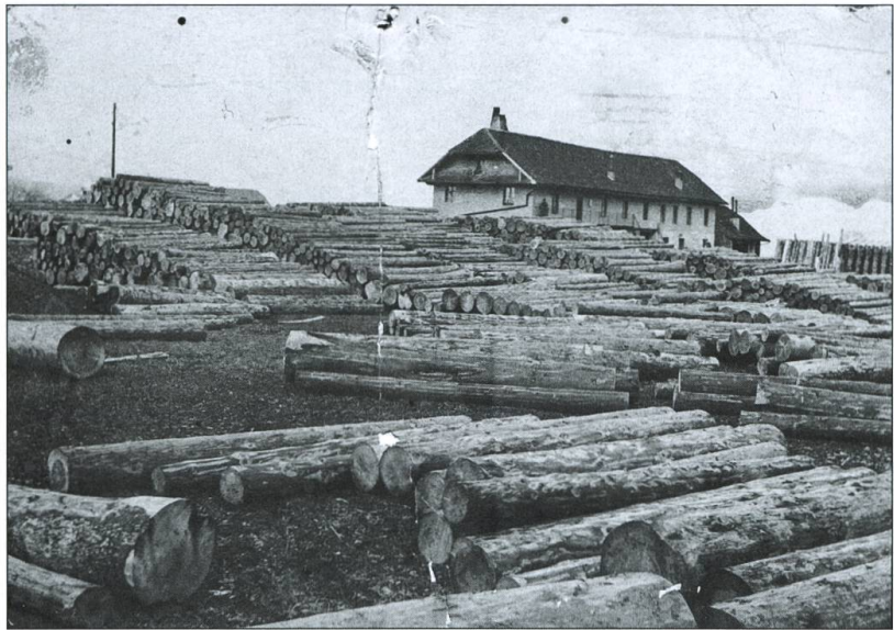
La scierie vers 1907.