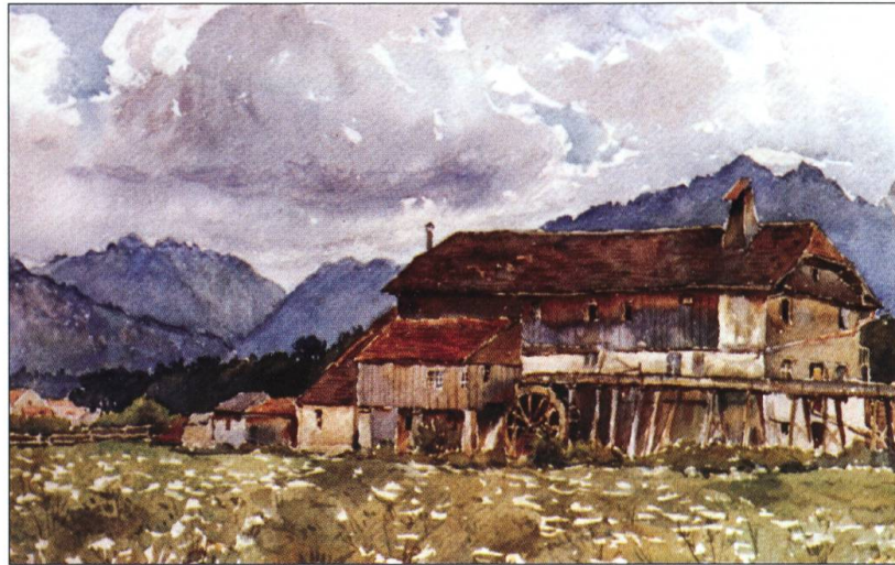
La scierie Dubas. Aquarelle peinte par un interné français pendant la guerre de 1914-1918.