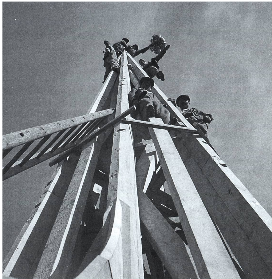
La construction du clocher de l'église de Grandvillard, par Maurice Beaud et Fils, en 1936.