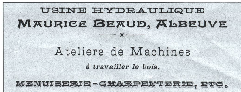
En-tête de l'entreprise en 1906.

Charles Beaud fait son entrée dans l'entreprise en 1937. Il se souvient des mandats réalisés pendant cette période: «Le Gros-Plané, c'était le premier, mais après, on a construit beaucoup de cha-