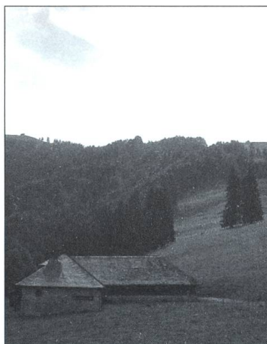
Chalet du Fragnolet sur Enney, 2006.

Et pour désigner les parties de cet ensemble issu de l'environnement même à partir duquel il tire sa propre production (finalement, cette définition sommaire est peut-être encore la meilleure), il faut un glossaire de plus de 150 termes où la terminologie de l'architecture se confond avec celle de l'économie alpestre: l'outil, la fonction, le produit sont bien, ici, indissociables, sous l'égide de l'armailli et de son train de chalet.»