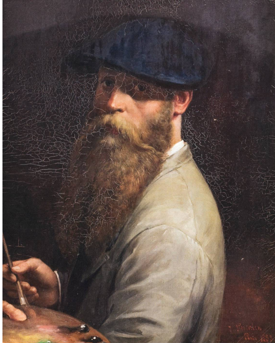
Joseph Reichlen: Autoportrait , Paris, 1893. Huile sur toile, 73 x 87 cm. MGB T-890. Acquisition 1974.

que toutes les parties du district y coopéreront». D'ailleurs une des premières décisions prises par le comité provisoire est de lancer une souscription aux particuliers ainsi qu'aux communes de la Gruyère pour qu'elles soutiennent le futur musée. Sans grand succès d'ailleurs, puisque seules deux communes y répondent favorablement: La Tour-de-Trême offre 20 fr. et Écharlens 40 fr.