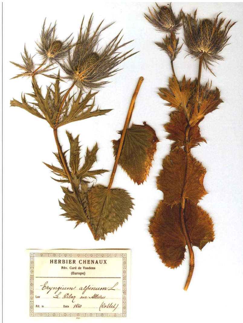
Chardon bleu collecté à Allières en 1860. Planche de l'herbier Chenaux.

A côté de l'herbier, ce sont surtout des animaux empaillés qui viennent agrandir la collection du futur musée, en particulier des oiseaux, comme ceux issus de la collection de Pierre Jacquiard, contrôleur au chemin de fer Bulle-Romont, «réputé excellent empaillieur» 6 dont la collection est en dépôt mais qu'on renonce finalement à acquérir, car elle est jugée trop onéreuse. Les animaux empaillés