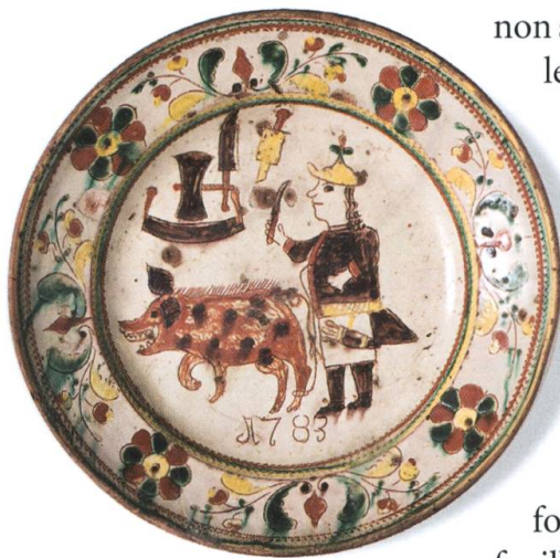
Plat décoré. Faïence. 1783. MGB IG-3551. Cet objet, qui appartient aujourd'hui au Musée gruérien, se trouvait dans la maison de Victor Tissot à La Roche Villebon (Seine et Oise). MGB.