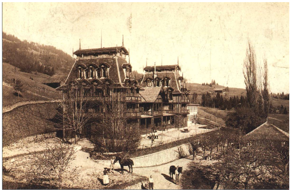
Le Grand Hôtel des Bains de Montbarry vers 1890. Inscription manuscrite au dos de la photographie: «Vue de l'hôtel de Montbarry dont l'idée de la reconstruction est due à Victor Tissot». MGB. Photo E. Fransioli, opticien, Montreux

Après plusieurs relances dans les journaux, l'Hôtel des Bains et ses dépendances sont acquises par Frédéric Bettschen-Borloz, propriétaire de l'Hôtel-Pension Visinand à Montreux. Il y fait encadrer le «chalet» et les galeries existantes par les deux vastes pavillons symétriques qui donnent à l'ensemble l'allure d'un palace rustique. «Avec son revêtement de bois, ses balcons et ses galeries ajourées, sa forêt de lucarnes, cette construction est l'une des réalisations majeures du Schweizer Holzstil dans le canton. Tissot le cosmopolite avait peut-être été l'un des premiers à rapatrier en Gruyère l'image du Swiss