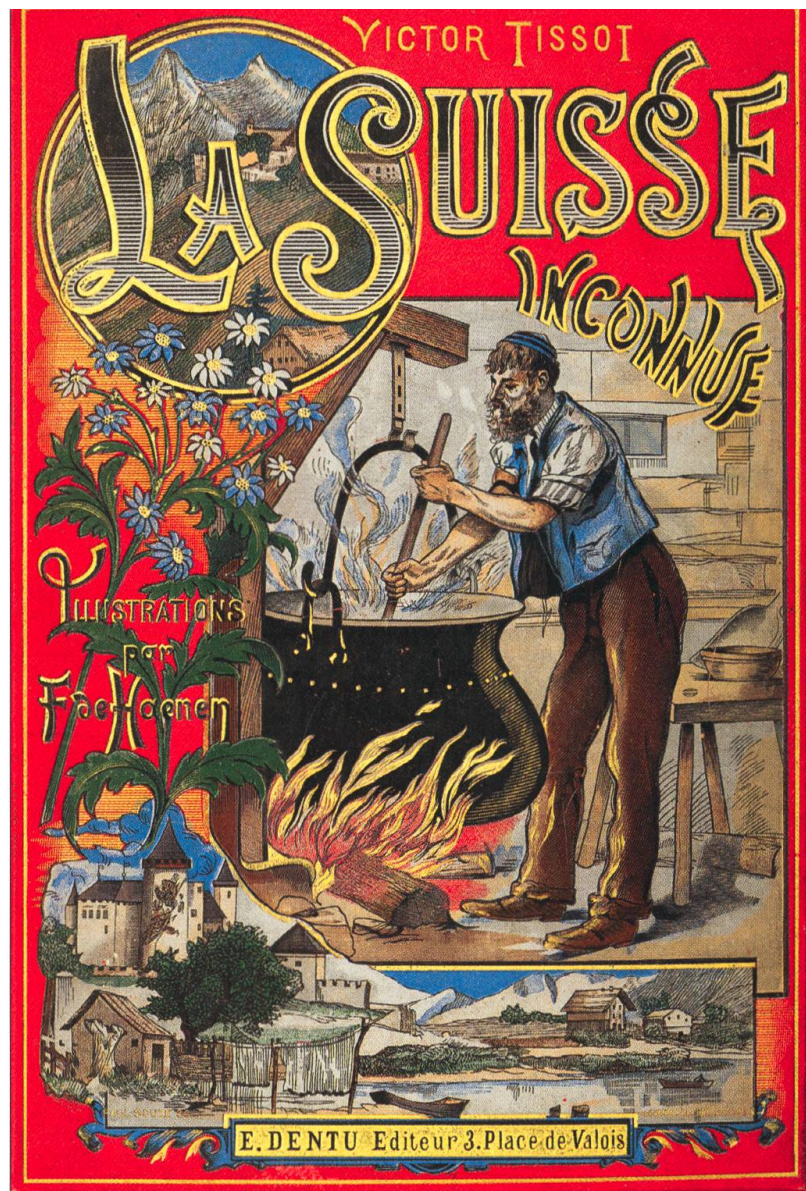
Couverture chromolithographique de La Suisse inconnue de V. Tissot. BCU Fribourg, cote RESQ 108.

Les modes passent, c'est bien connu, et l'œuvre de Victor Tissot, si parfaitement paramétrée pour toucher le lectorat de masse de la France de la Belle Époque, connaît un rapide déclin après la mort de son auteur. Des 141 entrées figurant dans le catalogue de la Bibliothèque nationale de France, aucune n'est postérieure à 1916, année de publication de L'Allemagne casquée , dernière reprise du Voyage au pays des milliards . En Suisse, deux rééditions chez Payot à Lausanne de La Suisse merveilleuse , en 1917 et en