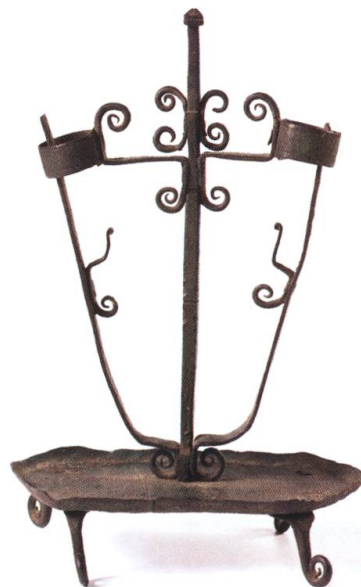
Chandelier double, vers 1800, de provenance inconnue. Fer forgé, peint, 36 cm. MGB IG-2166. Acquis par le conservateur Philippe Aebischer.