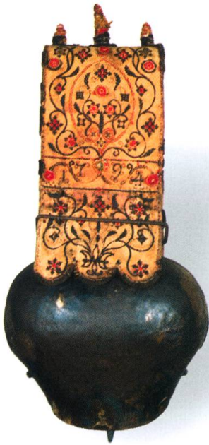
Sonnaïlle avec son collier daté 1794. Fer battu et cuir blanc brodé. MGB IG-8388 et 9. Achat en 1999.