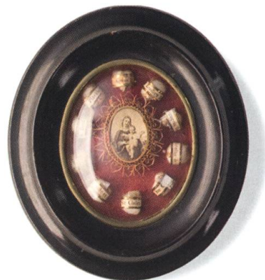
Tableau-reliquaire, vers 1900. Bois, papier, verre bombé, 14 x 12,3 cm. MGB IG-6274. L'image de la Vierge à l'Enfant est entourée de papier doré et de dix reliques.

«M. Despond a acheté à M. Pittet, tourneur, une vieille armoire en très bon état pouvant servir comme ameublement du futur musée gruérien 3 ». Il offre ce meuble daté de 1815 au musée. La commission décide alors l'ouverture d'un livre d'or, une liste dactylographiée où il figure en première place.