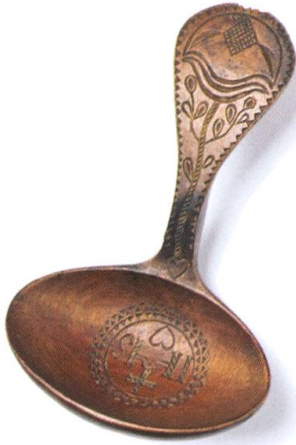
Cuillère à crème. Début XIX e siècle. Bois d'érable sculpté, 16 cm. MGB IG-7532. Achat en 1993. © Musée gruérien. Photo Primula Bosshard