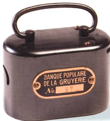
Tirelire de la Banque populaire de la Gruyère. Fer, 6 x 9,5 cm. MGB IG-5872. Acquise en 1974.

Les photographies sont collectionnées, produites et utilisées par le musée dès le début de son activité. Le tournant du XXI e siècle est marqué par l'acquisition des fonds Glasson et Morel puis Gapany, par la Société des Amis du Musée. Les conservateurs font un choix parmi le million d'images conservées sous forme de négatifs et Christophe Mauron organise un inventaire informatisé moderne. Numérisées grâce à Mémoriav (association pour le patrimoine audiovisuel suisse), 2500 photographies sont consultables sur internet. Avec les prises de vue de la fin du XIX e siècle de Jules Gremaud à Bulle, les négatifs sur verre réalisés par le curé Bochud à Neirivue avant l'incendie de 1904 et les fonds de la famille Schwarz à Riaz, avec une collection de cartes postales et de tirages classée topographiquement en 1996, avec des albums de positifs et des lots de diapositives, le Musée gruérien dispose d'une iconographie très riche sur la Gruyère, ses localités, ses activités et l'évolution de son paysage. Ces fonds deviennent accessibles grâce aux efforts de conservation, de numérisation et d'indexation. Avec la redécouverte en 2002 des daguerréotypes, réalisés en Suisse par le Français J.-Ph. Girault