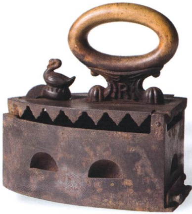
Fer à repasser à braises. Fonte et bois. MGB IG-3903. Reçu en don en 1929.

«On achète la monture en chêne d'un vieux presseur aux Faverges au domaine de l'Etat pour 300 francs. Le chêne servira à reconstituer de vieux meubles 4 .»