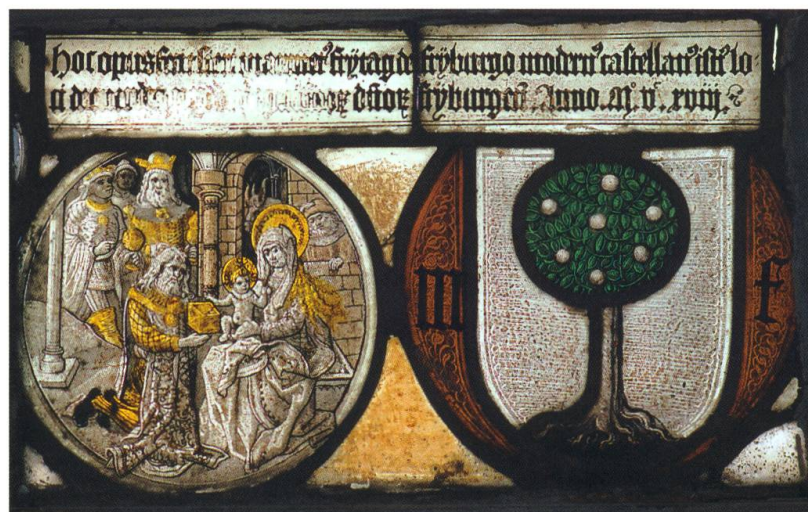
Rudolf Räschi: Vitrail, Adoration des Rois-mages et armoiries Marmet Frytag . 1518. 21 x 56 cm. MGB IG-1841. Acquis en 1924 à Echarlens.

Les relations se tendent en 1930, notamment suite à une enchère à Enney que le Musée gruérien fait monter au grand dam du Musée cantonal. L'archéologue cantonal le déplore auprès du directeur de l'Instruction publique: «Avec l'esprit particulariste qui caractérise la Gruyère, le Musée Tissot sera toujours favorisé par les Gruyériens, fait que nous constatons déjà fortement, car aucune offre ne nous vient plus de la Gruyère [...] Le but