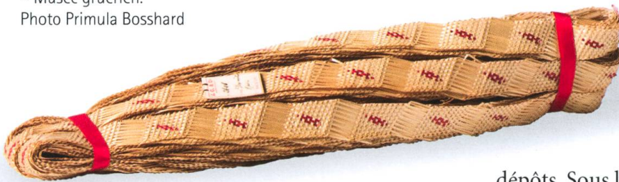
Tresse de paille de 24 m. Vers 1900. MGB.

poursuivi par ces messieurs de Bulle est d'exclure le musée cantonal de la Gruyère, ce qui est inadmissible, parce que précisément musée cantonal, c'est-à-dire musée de l'Etat fribourgeois dans son entier 18 .»