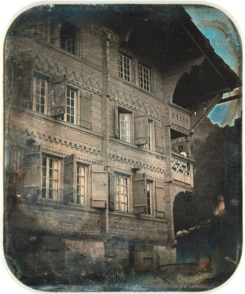
Joseph-Philibert Girault de Prangey (1804–1892): Façade d'une maison située sur l'Obere Gasse, côté est, Meiringen. Daguerréotype. 9,4 x 8 cm. 1845-1850. MGB.