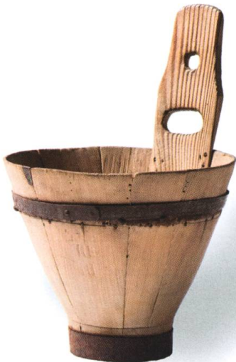
Seillon (en patois: brotsè ). Bois cerclé de fer, 46 cm. MGB IG-3695-2. Cet objet porte la marque de son utilisation. Reçu en don en 1928.