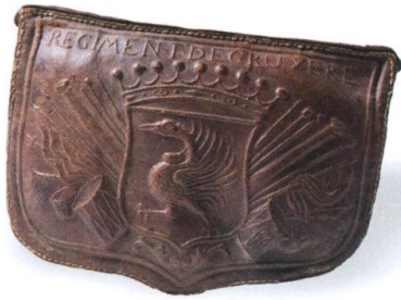
Giberne du régiment de Gruyère, 1745. Cuir gaufré, 15 x 21 cm. MGB IG-4156.

vivants n'auront lieu au Musée gruérien qu'après 1978, dans le nouveau bâtiment. Dès lors, Denis Buchs a suivi de près les travaux de la nouvelle génération d'artistes travaillant en Gruyère et acquis régulièrement leurs œuvres.