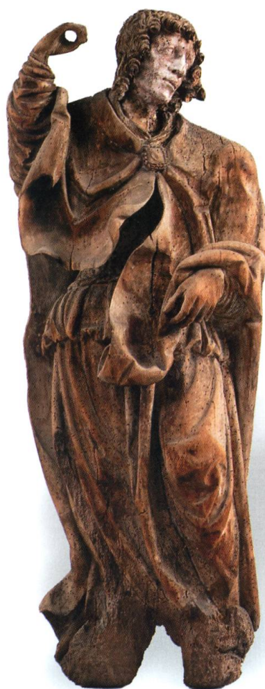
Statue de Saint Michel, XVI e siècle. Bois de tilleul, 98 cm. MGB IG-5716. Récupérée par Henri Gremaud en 1954. © Primula Bosshard

H. Gremaud fournit régulièrement des documents, des objets pour des expositions et des reportages sur les artisans: le boisselier, le sculpteur de cuillères, la tisserande. Toutefois il