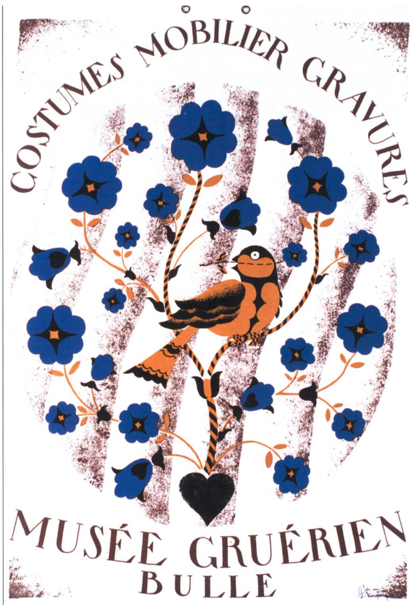
L'affiche du musée en 1930. Dessin Paul Dupasquier.

En 1923, l'historien genevois Henri Naef prend les rênes de l'institution. C'est à lui qu'il revient de l'installer dans ses locaux et de l'inaugurer quelques mois après son entrée en fonction. La politique d'acquisition est révisée, circonscrite «à la Gruyère, en premier lieu, au canton de