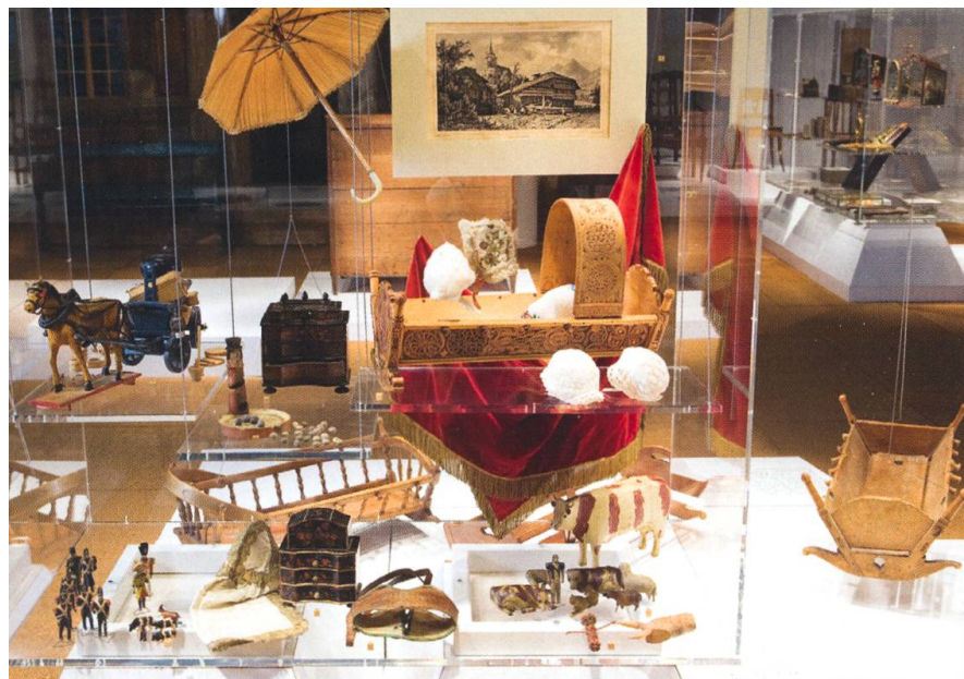
Le secteur de l'enfance et des jeux dans l'exposition permanente, 2009.

Les professionnels ressentent aujourd'hui la nécessité de faire évoluer ces musées, mais la solution est loin d'être toute trouvée 25 . Le modèle des musées de beaux-arts ne peut conférer qu'un statut mineur et ambigu aux «objets d'art populaire»: pour leur permettre d'être valorisés selon des critères esthétiques, leurs conditions de production et d'utilisation doivent s'effacer dans un passé lointain. Ce qui constitue un patrimoine est bien dans ce cas l'objet lui-même, et non des pratiques dont seul un souvenir imagé – plutôt qu'une vraie documentation scientifique – trouve place au musée: l'évocation de la fabrication et de la mise en œuvre des objets utilitaires se fait au mieux sur le mode d'un sentimentalisme passéiste.