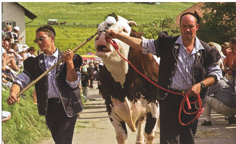
Cortège de la Fête de la Poya, Estavannens 2000.

fréquemment constellée d'edelweiss, probablement parce qu'elle est la plus disponible dans la qualité voulue et que le bleu s'accorde bien avec celui du bredzon. Progressivement, ce code vestimentaire s'impose lors des désalpes et même dans l'uniforme de certaines sociétés. La chemise bleue est adoptée pour des prestations peu formelles alors que la blanche reste de mise pour les fêtes. En moins d'une génération, la chemise edelweiss est devenue traditionnelle.