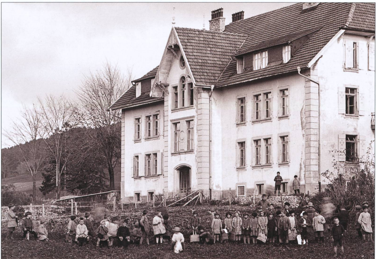
Semsaies, maison d'école, 1930.