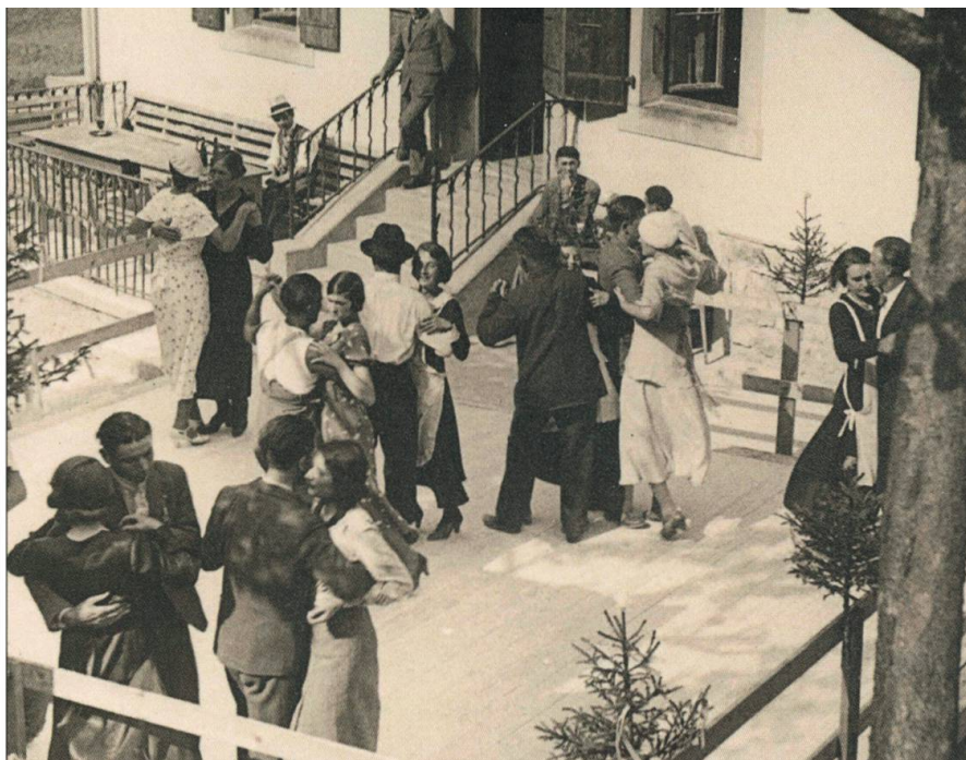
Pont de danse de la bénichon à Motélon, vers 1935.

Les auberges doivent être fermées entre 22 heures 30 et 4 heures du matin. Avec une nouveauté: les buffets de gare peuvent rester ouverts «une heure après le passage du dernier train du soir». Les auberges sont toujours fermées pendant les offices, sauf pour les voyageurs.