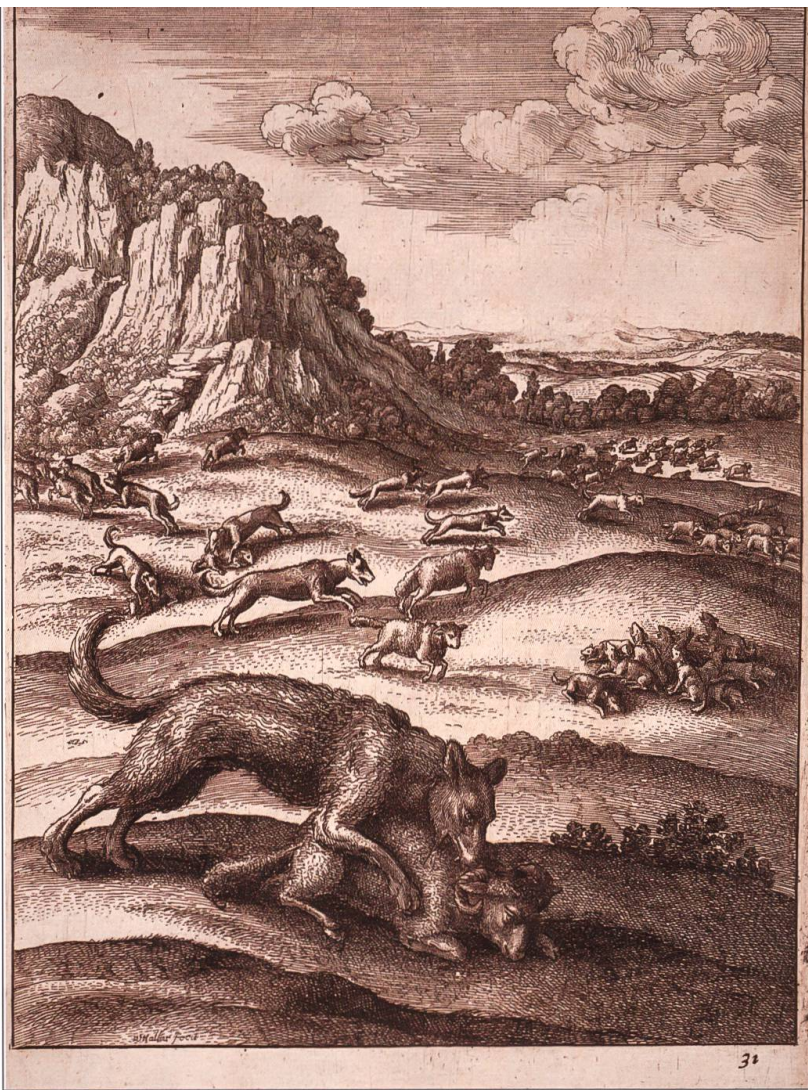
Le loup était vu comme un véritable fléau qui ravage les troupeaux. Illustration de Wenceslas Hollar, XVII e siècle