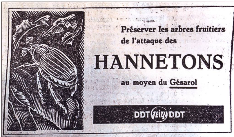
La lutte chimique contre les hannetons est principalement déployée après la Seconde Guerre mondiale. Le Gésarol est l'un des multiples produits utilisés. La Liberté , 16 avril 1948

« Ainsi, si cette expérience [la lutte chimique] donne d'heureux résultats, il sera bientôt fini le temps où les enfants partaient tôt le matin secouer les branches des arbres où dormaient les « cucars » engourdis, puis ramenaient à la commune de grosses caisses de ces lourds insectes qu'on enterrait ensuite ou brûlait. Pour ma part, je n'ai jamais beaucoup aimé cette sorte de petite guerre, car ces hannetons dodus m'inspiraient plutôt de la répugnance que de l'amitié. Aussi, je ne pleurerai pas si désormais l'hélicoptère vient me décharger du souci de mener moi-même la bagarre contre le coléoptère. Mais, comme tant d'autres choses, la lutte contre les hannetons faisait partie des habitudes, elle avait sa place réservée dans le cours normal de notre existence, comme la moisson ou la cueillette des fruits. Pour le moment, il restera suffisamment de hannetons pour que les enfants ne soient pas encore privés du plaisir de leur attacher un fil à la patte et de les retenir prisonniers dans leurs mains. Mais les hannetons seront soumis à rude épreuve, car c'est désormais la technique qui va leur faire la guerre. »