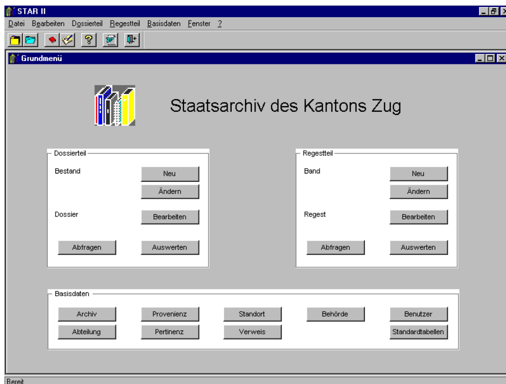
Abb. 2: STAR II, Grundmenü. Deutlich sichtbar ist funktionale Dreiteilung mit den verwalteten Tabellen, dem Dossier- und dem Regestteil. Die letzteren gliedern sich in zwei Bereiche, nämlich die Erfassungs- und Bearbeitungsfunktionen der Bestände und der Dossiers bzw. der Bände und der Regeste und die Abfrage und Auswertung.

STAR II gliedert sich inhaltlich in drei Arbeitsbereiche, nämlich den Bereich Basisdaten, den Dossier- und den Regestteil, letztere wiederum haben drei funktionale Gliederungen, die Erfassung und Bearbeitung der Daten, die Abfrage und die Auswertung (Druck von Listen und Verzeichnissen) (Abb. 2).