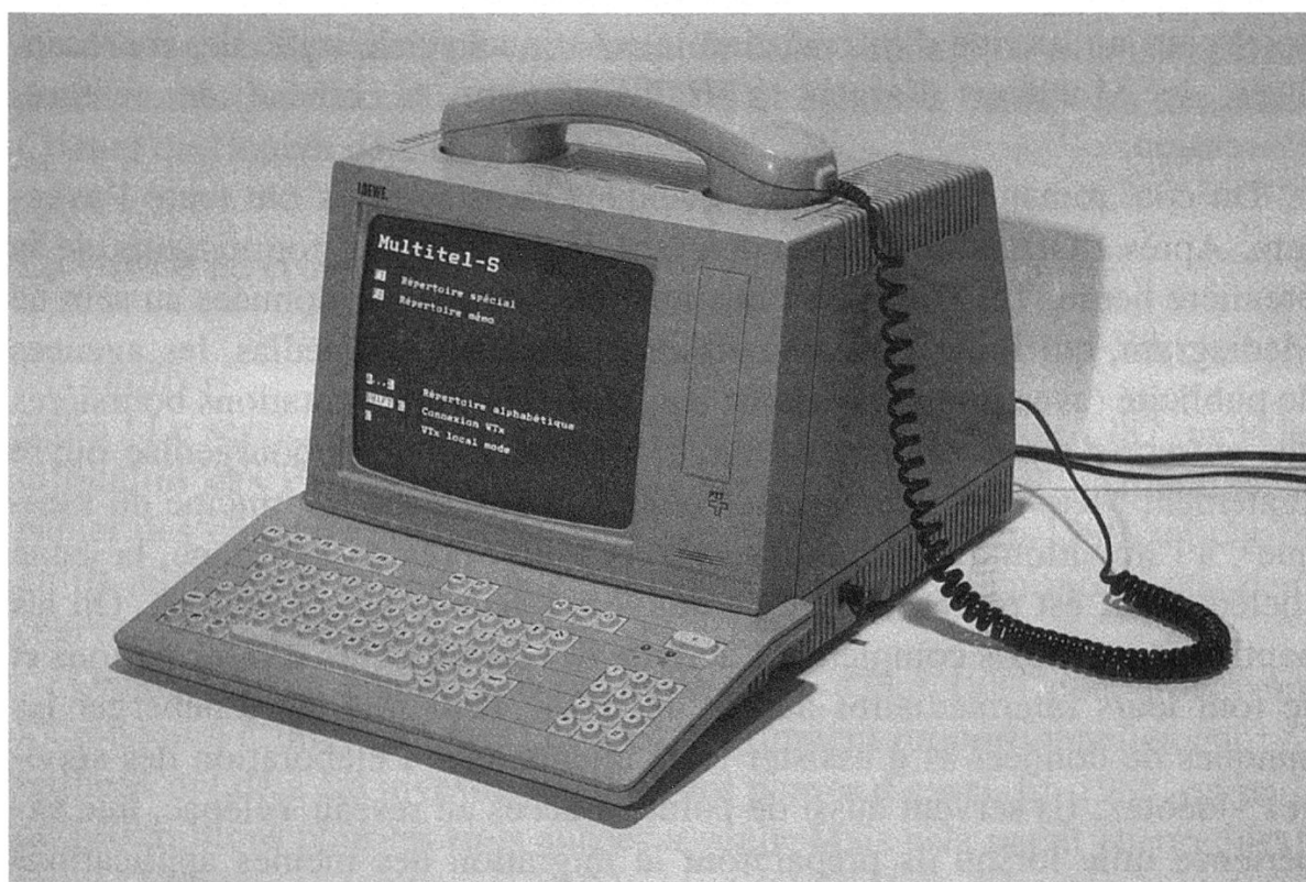
Figure 2: Multitel, terminal loué par les PTT aux abonnés Vidéotex à la fin des années 1980.