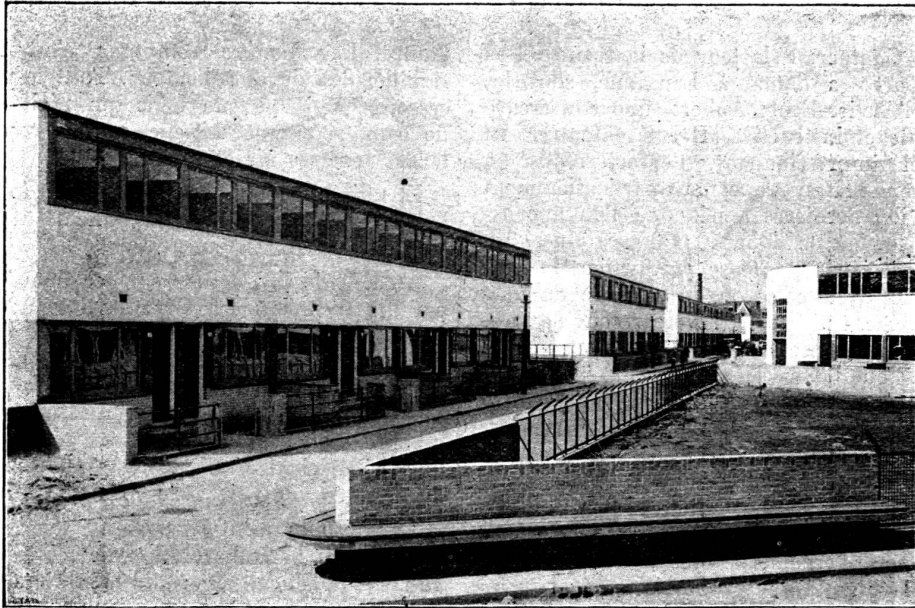
Une rue de la Cité.

est dans le sud, au-dessous de la colline de la Chapelle, au-dessous de la colline de la Chapelle, au-dessous de la colline de la Chapelle.