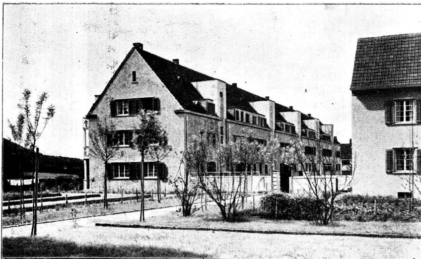
Hintermeisterhof 1 re étape de construction de maisons collectives.

Comme ceux des deux premières étapes, les logements de la troisième sont soigneusement installés, avec l'eau chaude, des fourneaux et des lessiveuses électriques. Le sol des chambres et des corridors est revêtu de linoléum, la couleur des vernis est bien étudiée et les tapisseries choisies avec goût.