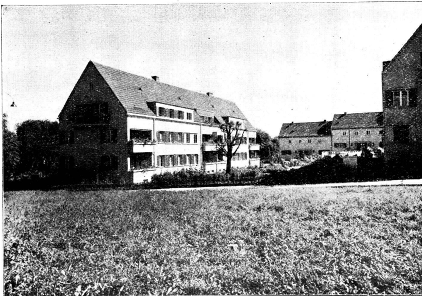
Cité-jardin de Entlisberg.

1 re étape de construction de maisons collectives de Hintermeisterhof.