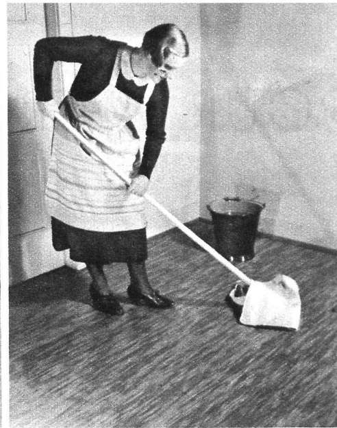
Le premier nettoyage au balai • Ne pas laver ainsi, il y a trop d'eau • Un simple torchon humide suffit