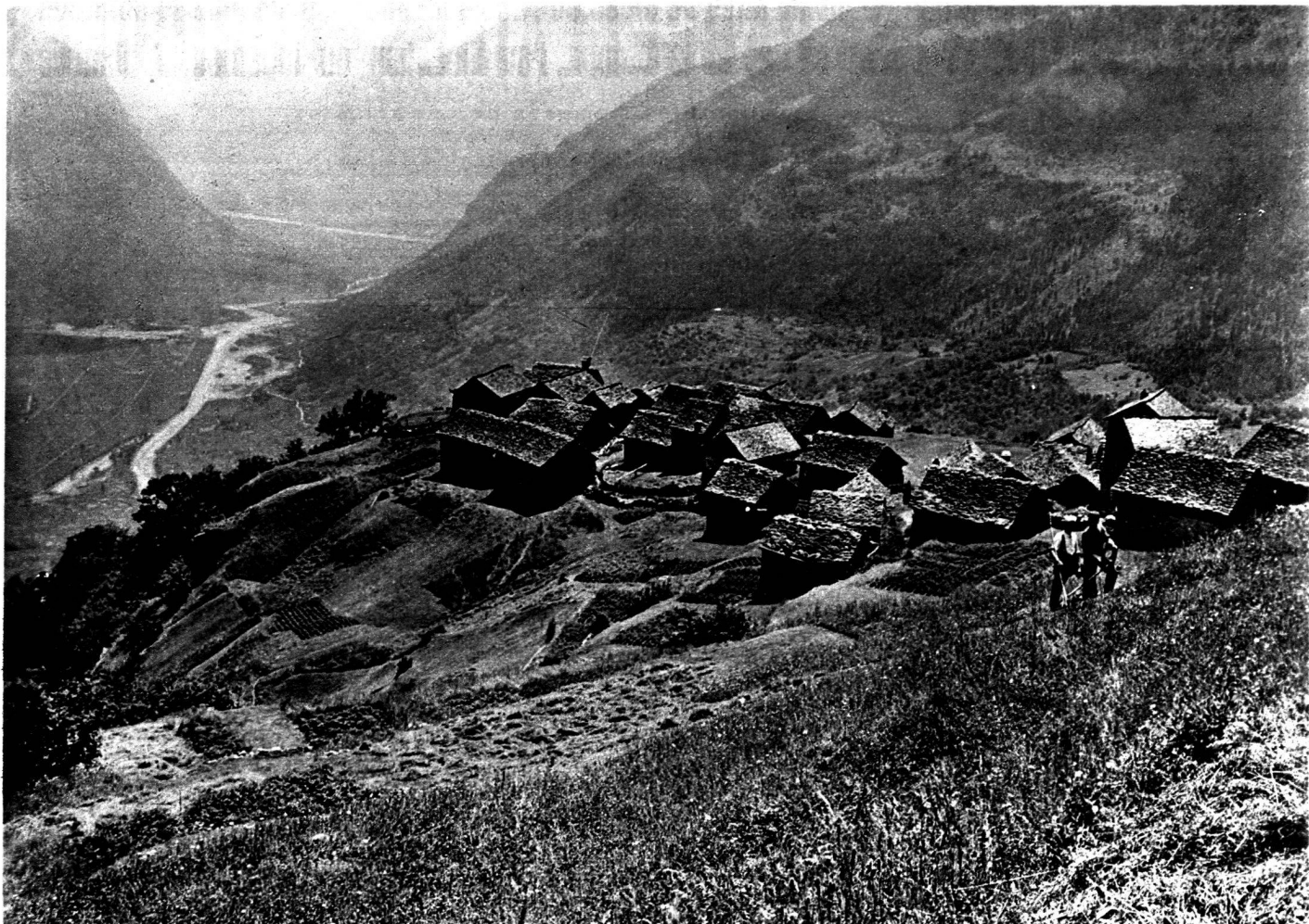
Le village dominant la vallée MONTE STABIO Le village au flanc de la montagne ×