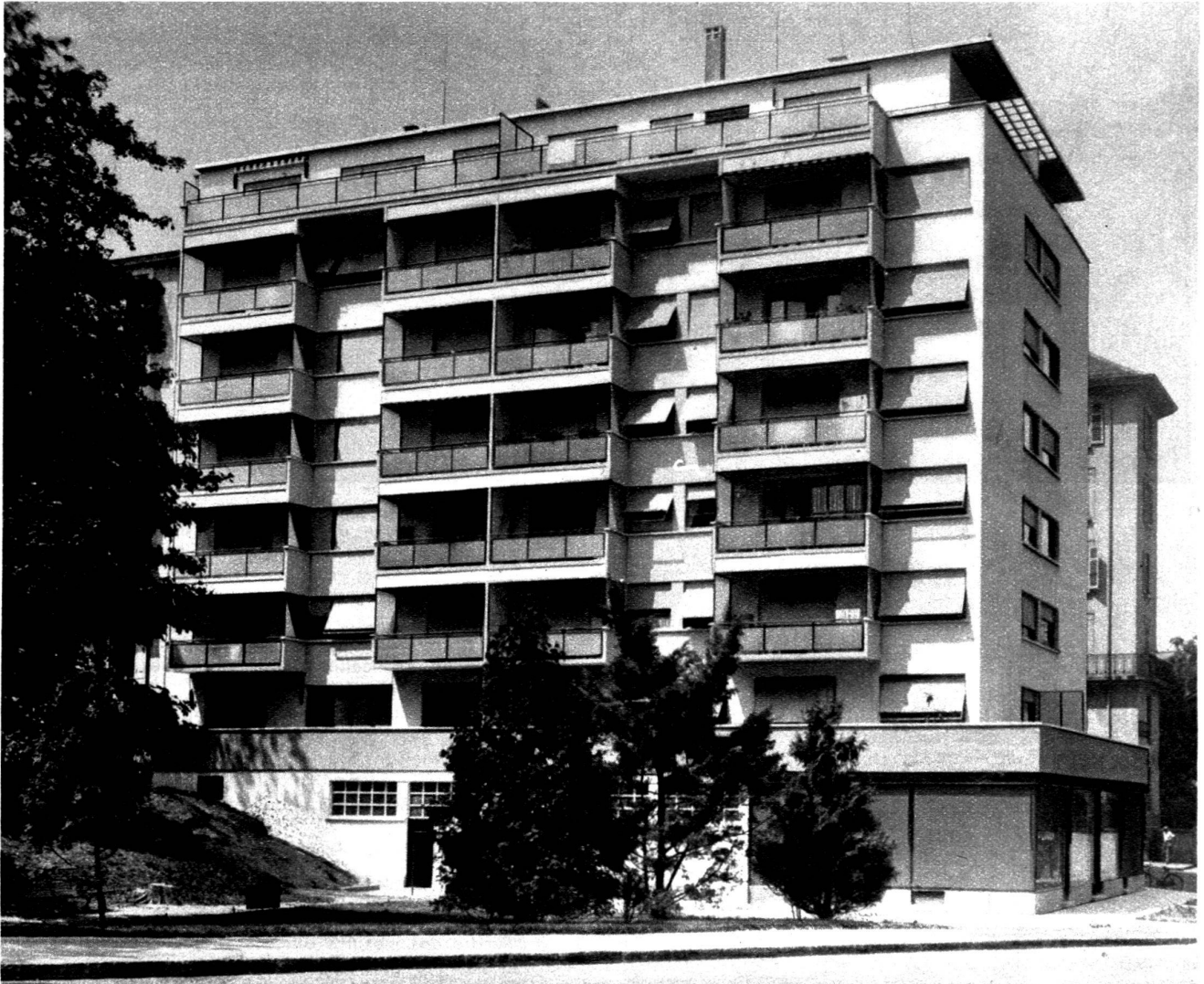
Immeuble chemin de Roches, 1 et 3. 2 me prix des grands immeubles. Francis Quétant, arch. F.A.S., Genève.