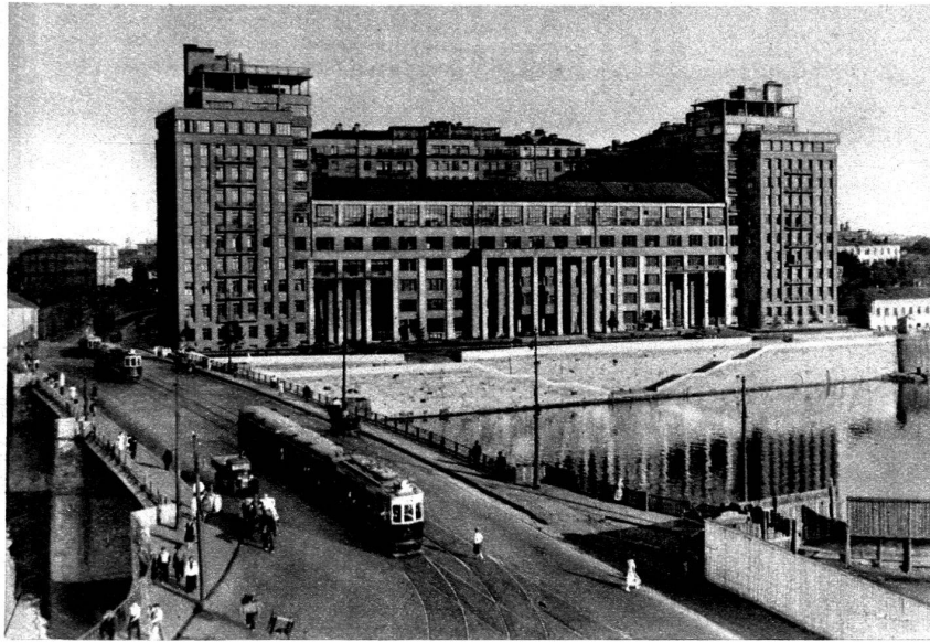
Une des premières unités d'habitation avec services communs, au centre de Moscou (construite 1928-1930). Remarquez les poutonniers sur la toiture des deux ailes.