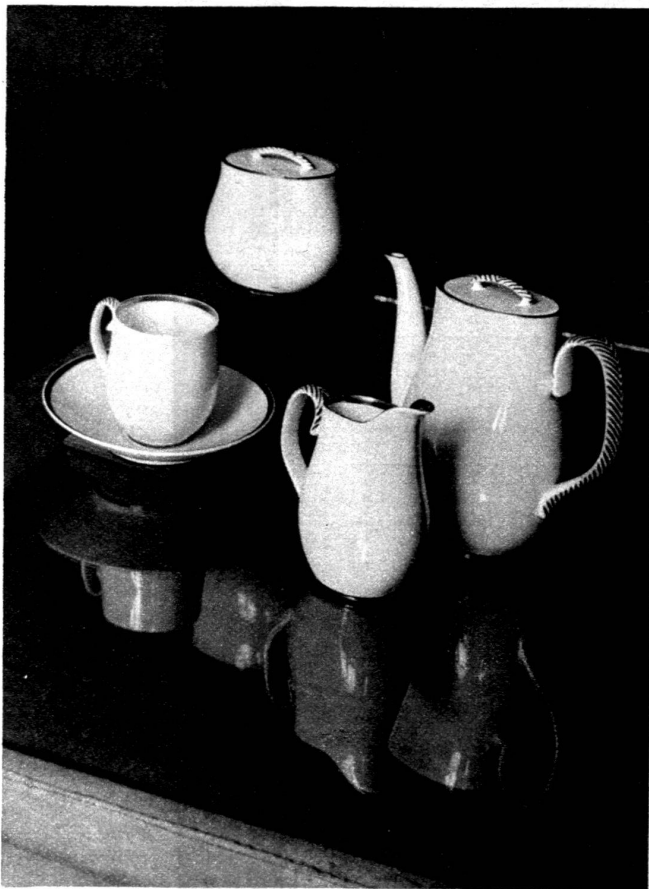
L'étude de l'aménagement intérieur s'étend au mobilier et à la vaisselle. Voici un service à thé standard dont les formes sont d'une élégante sobriété.