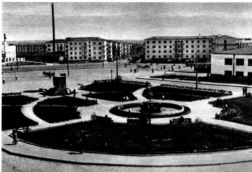
Colonie d'habitation d'une usine dans l'Oural. On remarque l'ampleur des rues et places de cette agglomération.