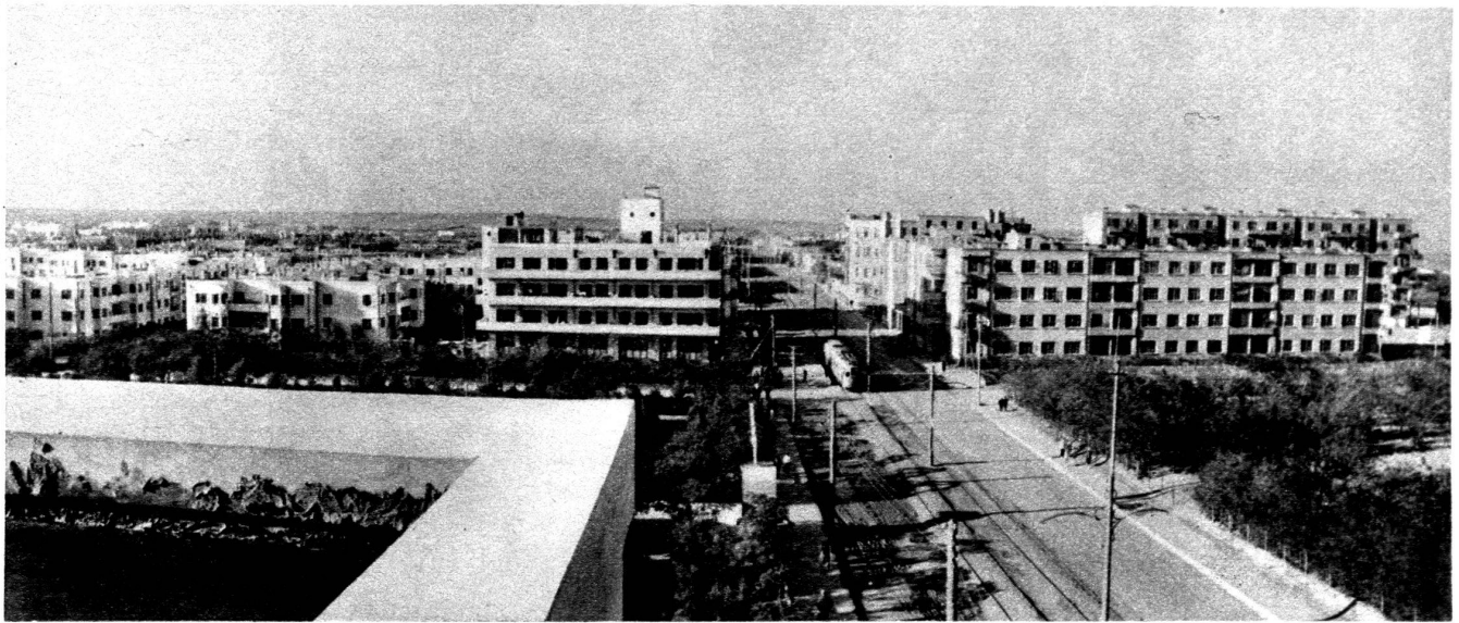
Le nouveau quartier arménien à Bakou.

sonne. Cette surface est actuellement en augmentation et le programme économique du pays prévoit des étapes à 7,5 mètres carrés et ensuite à 9 mètres carrés par personne. Fait curieux, les nouvelles prescriptions sur la construction exigent également une augmentation de la hauteur des chambres à 3 mètres au minimum dans tout le territoire de l'U. R. S. S. (à Genève : 2 m. 50 ; canton de Vaud : 2 m. 40).