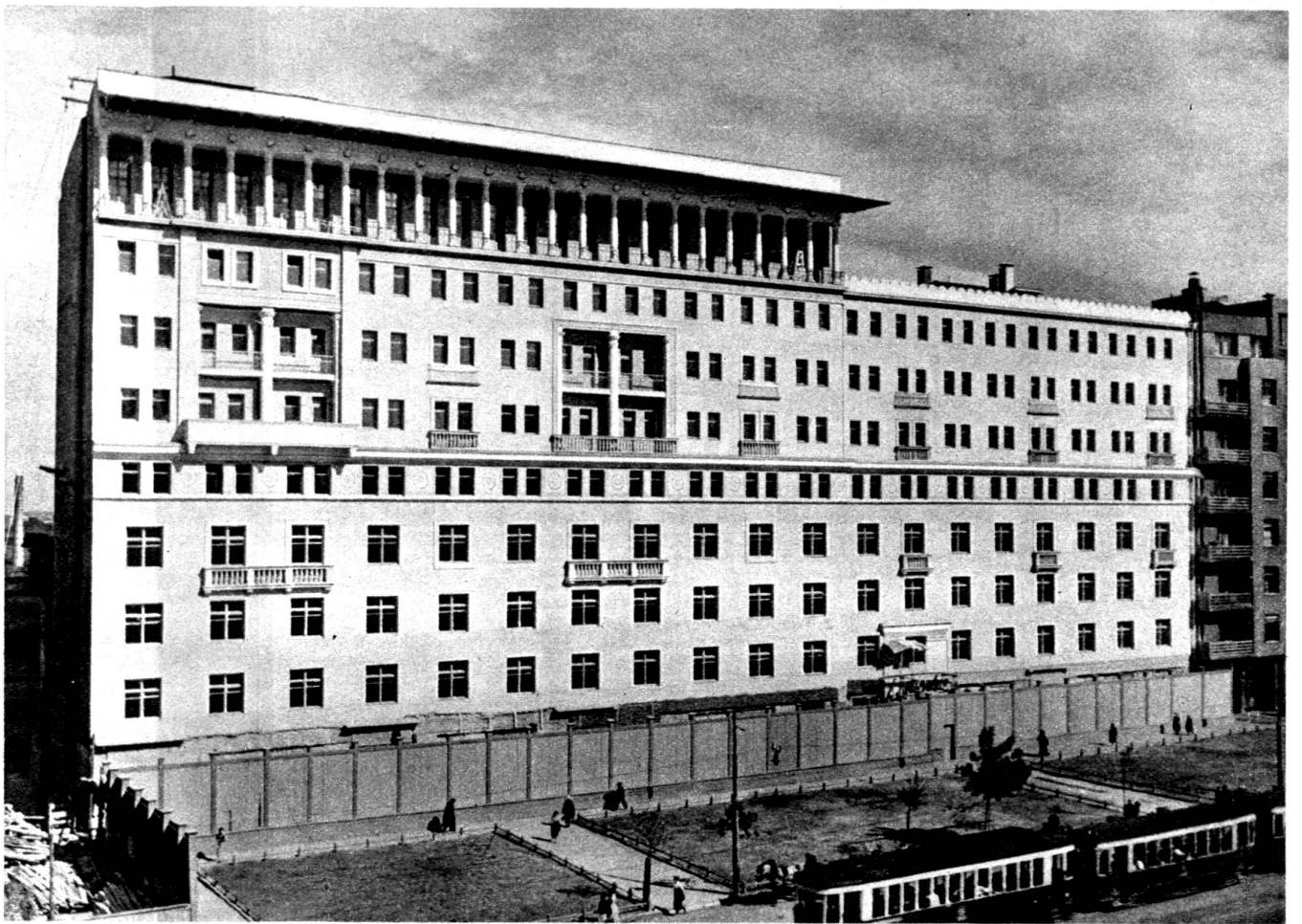
Maison du personnel technique à Moscou, sur le boulevard circulaire B, achevée en 1935. Les appartements de trois à cinq chambres, avec le dernier confort, ont été répartis aux plus actifs techniciens, savants et artistes. Parmi eux on trouve des professeurs éminents, des as de l'aviation, et même un garçon de dix ans, jeune prodige musicien. L'aspect est bien dans la ligne de l'architecture russe actuelle, qui s'apparente à celle de l'Amérique du Nord.