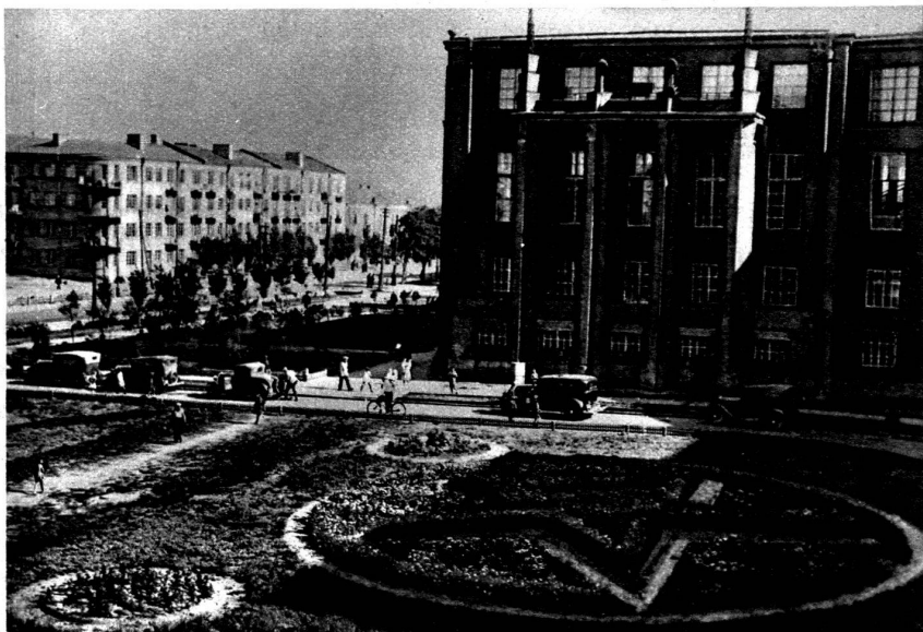
Partie d'une colonie d'habitation des établissements métallurgiques de Dniepropetrovsk (à droite, un club).