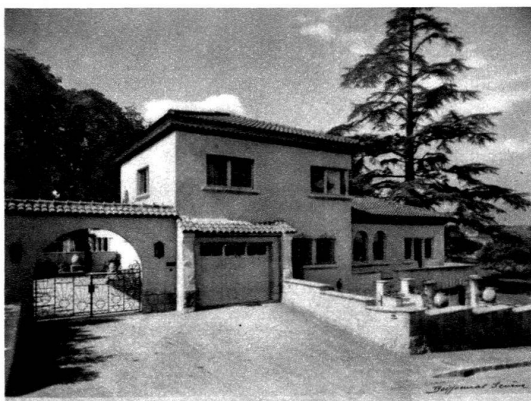
Vue de l'entrée.

La villa de M. P. V., industriel, fait partie d'un groupe de maisons luxueuses situées dans l'ancien domaine de Plongeon, sur la rive droite du lac, à proximité du centre de la ville.