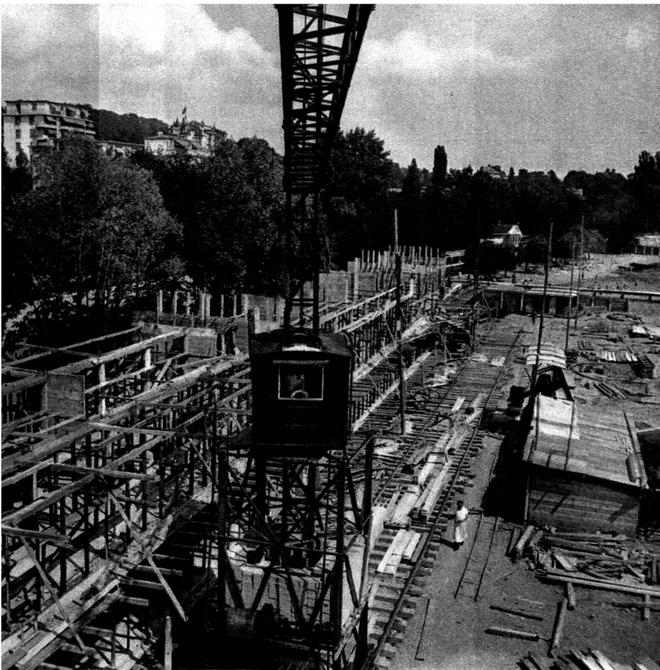
Les coffrages pour la construction des cabines.