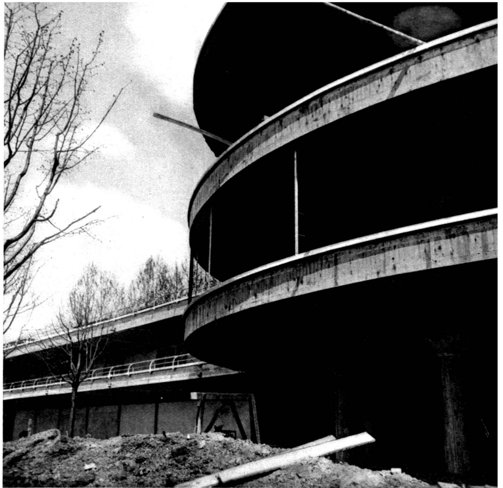
La rotonde après le décoffrage extérieur.