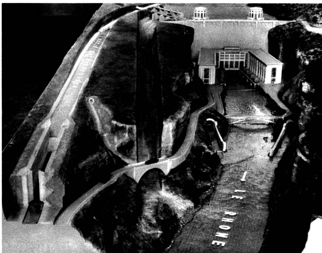
Le futur barrage de Génissiat.

La maquette montre, à gauche, le canal et l'écluse de navigation ; au centre, le canal pour l'écoulement des crues du fleuve ; à droite, le Rhône avec l'usine hydro-électrique et, au fond, le grand barrage surmonté des tours de prise d'eau. De chaque côté de l'usine, on aperçoit la sortie des canaux souterrains destinés à l'écoulement des eaux qui auront alimenté les turbines de l'usine.