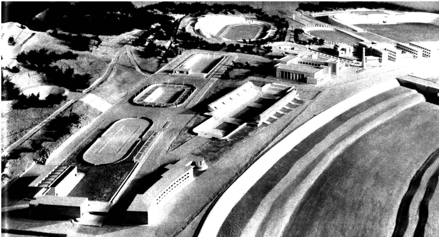
Le Forum Mussolini, à Rome.

Cependant, un examen plus attentif permet de constater que, dans ce domaine, un temps d'évolution est nécessaire. Il semble qu'en Italie on veuille tout ou rien. Si, d'une part, la nation a trouvé l'expression plastique de son caractère dans la construction et le renouvellement des villes, cet effort est nécessairement limité à un certain nombre de cités. Que deviennent les autres avant de recevoir le plan directeur et d'aménagement approuvé par le gouvernement? Des mesures intermédiaires telles que le « zoning » seraient à même de prévenir les erreurs inévitables avant l'établissement d'un plan définitif.