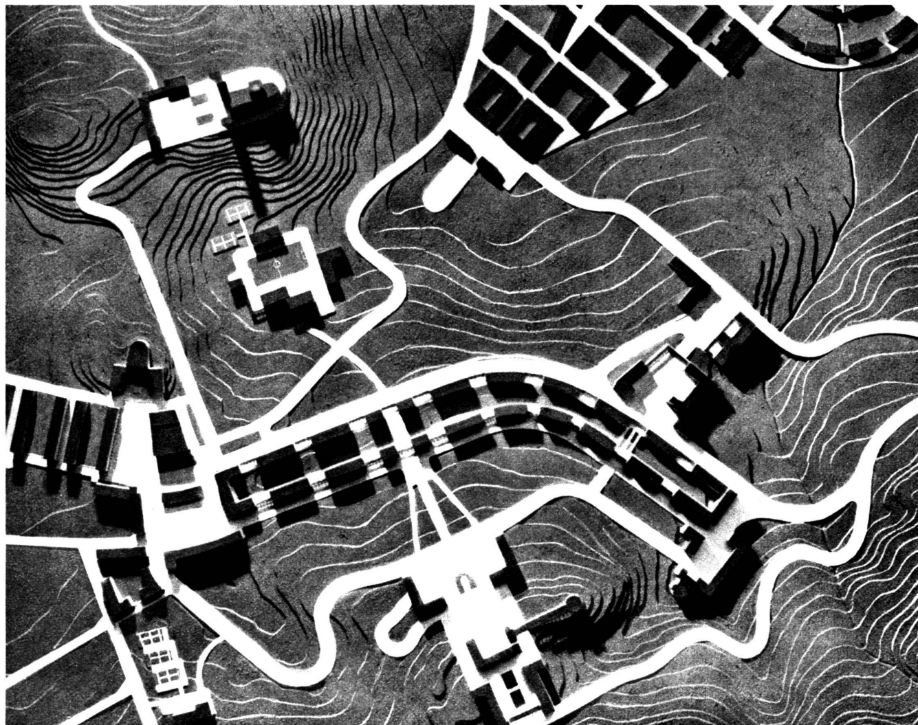
Les nouvelles villes coloniales : Projet pour le centre de Gondar.

Ceux qui ont pu suivre le développement de l'urbanisme italien ont constaté que, des mesures rudimentaires d'il y a une vingtaine d'années, il a passé durant cette dernière décennie à des conceptions audacieuses qui dépassent les réalisations de pays tels que l'Allemagne et l'Angleterre, qui furent à la tête du mouvement.