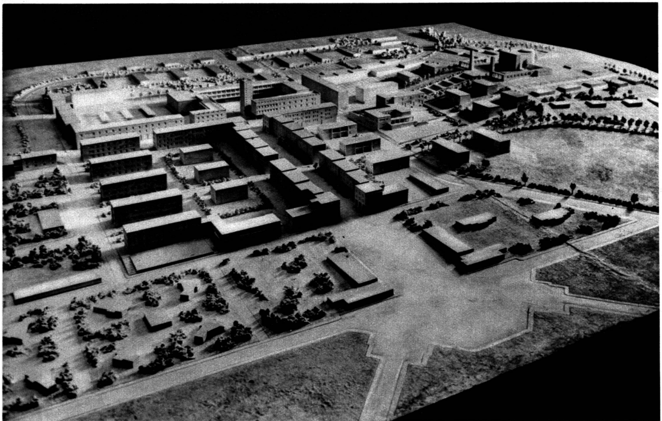
Guidonia : la ville de l'aviation.