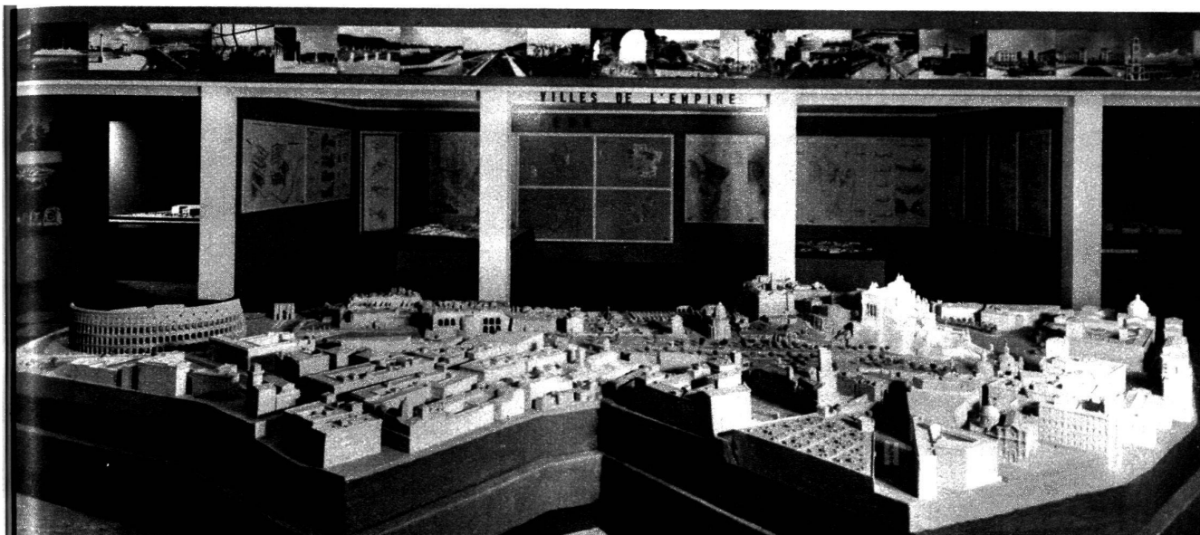
Maquette de la Via del Impero. A gauche, le Colisée ; à droite, le Capitole et la Piazza Venezia.