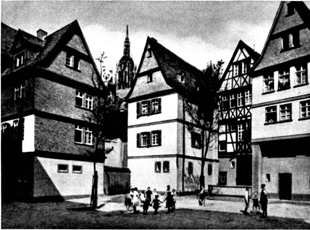
Francfort-s.-Main. Assainissement de la Grosse Fischergasse. Les pignons ont été restaurés, de nouvel- les baies ont été per- cées. La démolition d'un mitoyen a ouvert la vue sur la Cathé- drale.