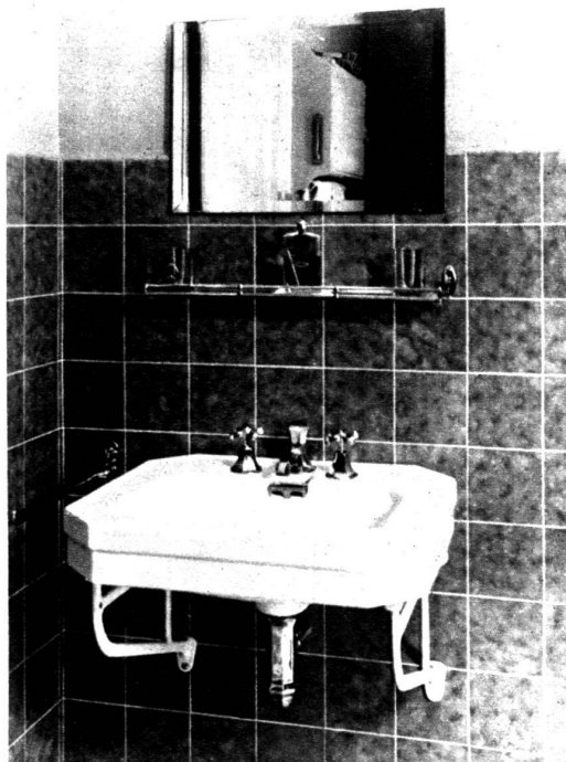
Modèles de lavabos.