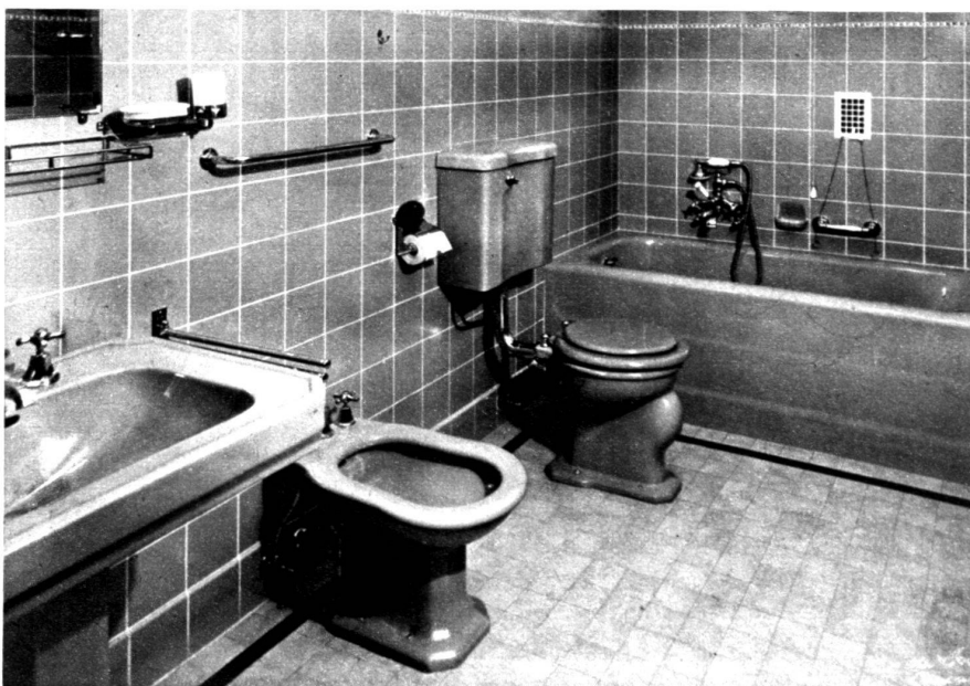
La qualité des appareils est la marque de cette salle de bain.