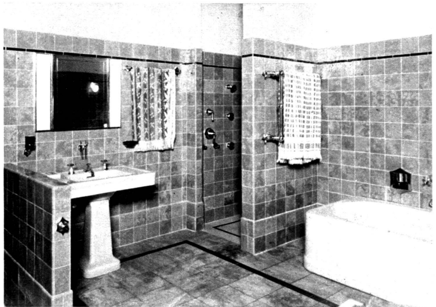
En haut et au milieu : salles de bain intéressantes par l'heureuse disposition des appareils. (Documents Diemand.) (Photos Ch. Gerber.)