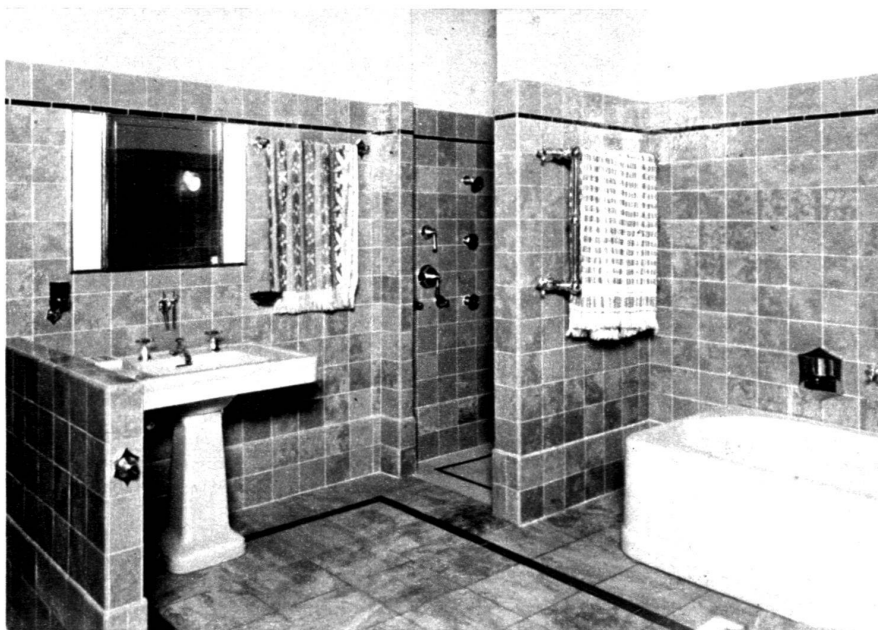
En haut et au milieu : salles de bain intéressantes par l'heureuse disposition des appareils. (Documents Diemand.)