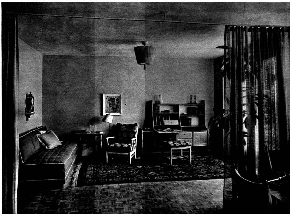
Au-dessous : Divan-lit transformable avec housse en tissu piqué couleur aubergine, bibliothèque-secrétaire et sièges recouverts de tissu brun brodé mastic.

Exécuté par Tr. SIMMEN & Cie S. A., Rue de Bourg 47-49, Lausanne. Brugg & Zurich.