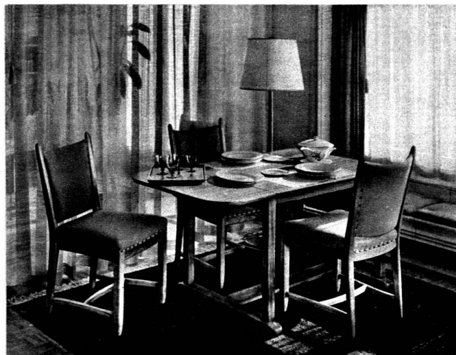
Au-dessus : Table à manger dépliant avec sièges rembourrés, bois de noyer clair mat et tissu beige clair sur tapis tête de nègre.

Qu'à des formes plaisantes à l'œil il sache unir l'heureux équilibre des masses et l'agréable im-