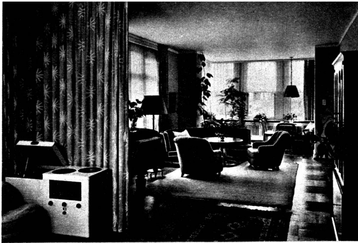
un salon de musique et le coin de véranda.