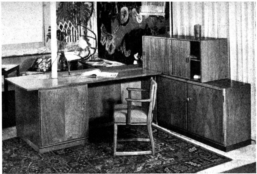
Table de travail et meuble de rangement.