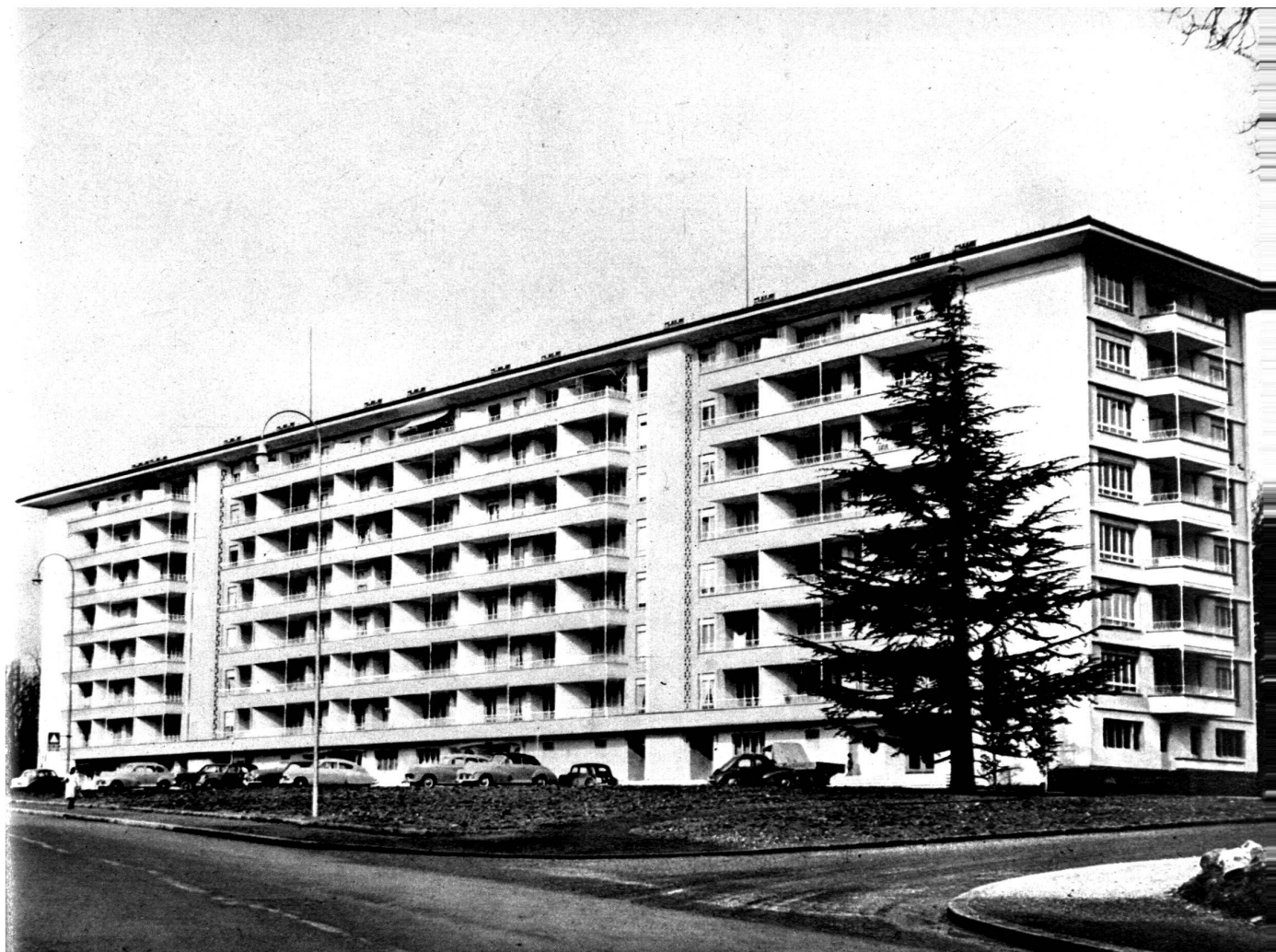
Vue générale de l'immeuble, façade ouest.