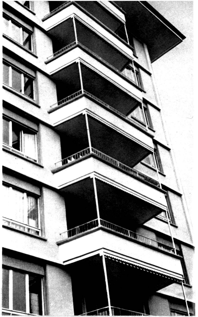
Vue de la grande façade.