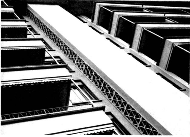
Détails des claustras décoratifs.

Les balcons sont largement abrités sous l'avant-toit.