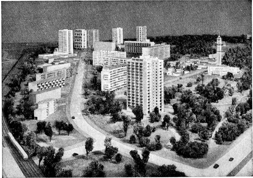
Détail montrant le sud du quartier Hansa, vu du sud-ouest.