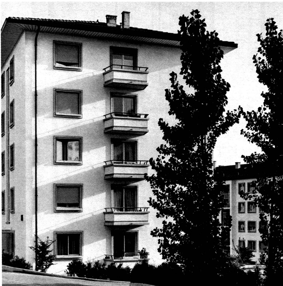
Groupe de Montétan Vue d'une des façades ouest.