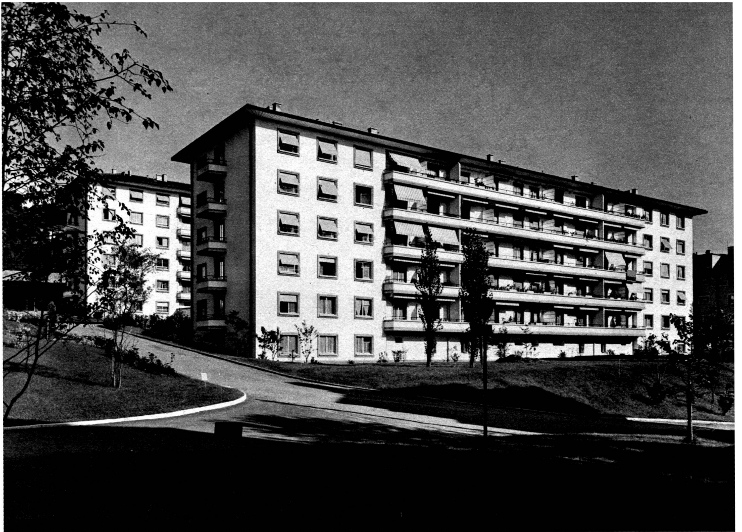
Groupe de Montétan Bâtiments I et II, façades sud