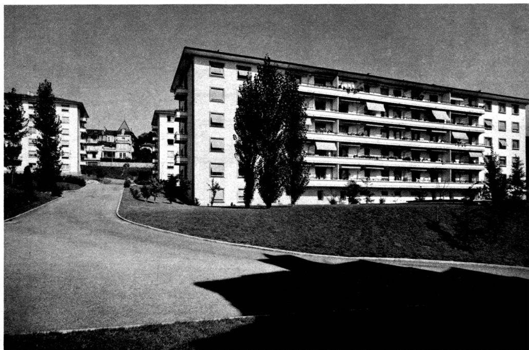
Groupe de Montétan Bâtiment I (B), façade sud.