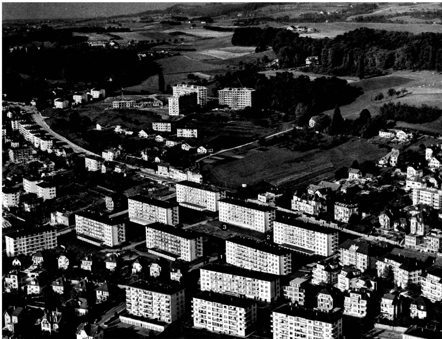
Groupe de Montétan - Les bâtiments 1, 2, 3 sont ceux de la Coopérative d'habitation