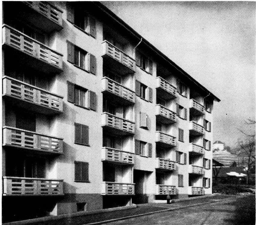
« Les Lauriers » 20 appartements de 1, 2, 3, et 4 pièces.

et un au-dessus de Montreux, Les Trois Tilleuls , de seize appartements de deux, trois et quatre pièces. Grâce aux soins attentifs de notre architecte, nous avons pu, dans le cadre des crédits accordés, installer le chauffage central et l'eau chaude générale, ainsi que des tentes à chaque balcon.