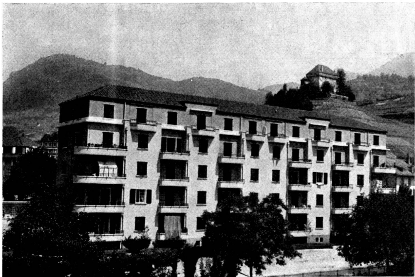
« Les Bouleaux » construit en 1932, 20 appartements de 3 pièces, 10 de 2 pièces chauffage central et eau chaude par appartement.