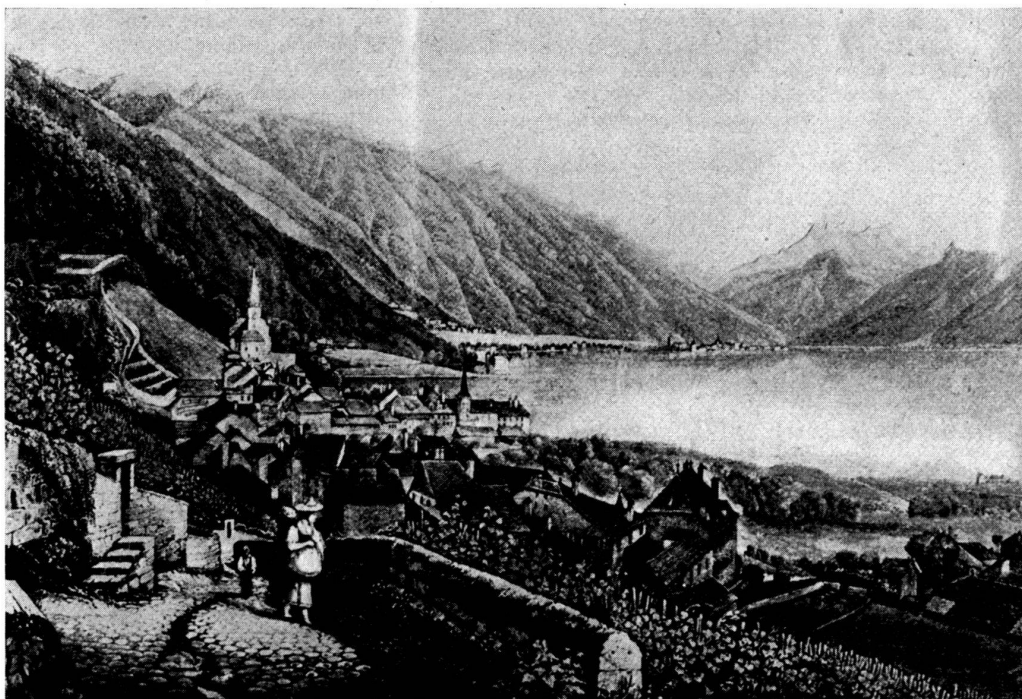
Montreux, il y a cent ans. (D'après une ancienne gravure, photo J. M. Schlemmer.)

toire des documents écrits : antiques parchemins et poudreux registres des archives épiscopales. Car l'archéologie nous fait remonter infiniment plus haut. Elle nous signale la présence, il y a... six mille ou dix mille ans,