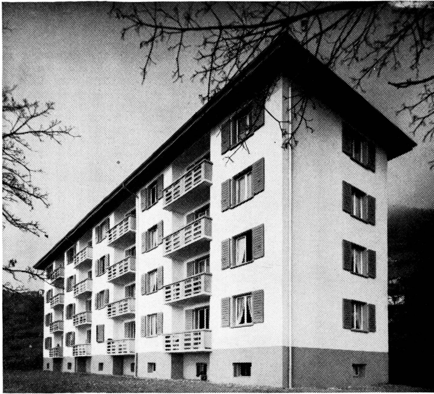
« Les Trois Tilleuls » 16 appartements de 2, 3 et 4 pièces.

immobiliers de la région donna lieu à une campagne mémorable où tous les moyens furent mis en œuvre pour faire avorter notre projet. Ce fut l'occasion d'entendre cette énormité de la part d'un médecin montrousien : « ... qu'est-ce que c'est que cette légende de baignoires pour des ouvriers?... ». On a évolué depuis !