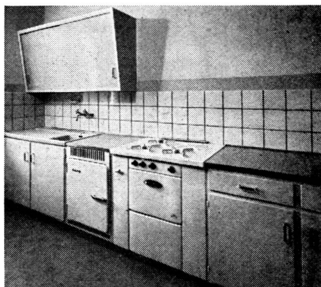
Le four et le réfrigérateur modernes à gaz dans une cuisine moderne.