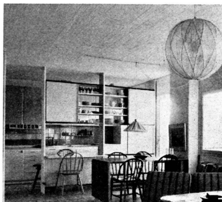
Dans un immeuble locatif d'expérimentation à Göteborg, on a laissé de côté la paroi entre la cuisine et la salle de séjour, sans qu'un locataire l'ait regrettée.

N. B. - Les trois articles sur le problème de la cuisine sont traduits de la revue Bauen und Wohnen , Zurich.