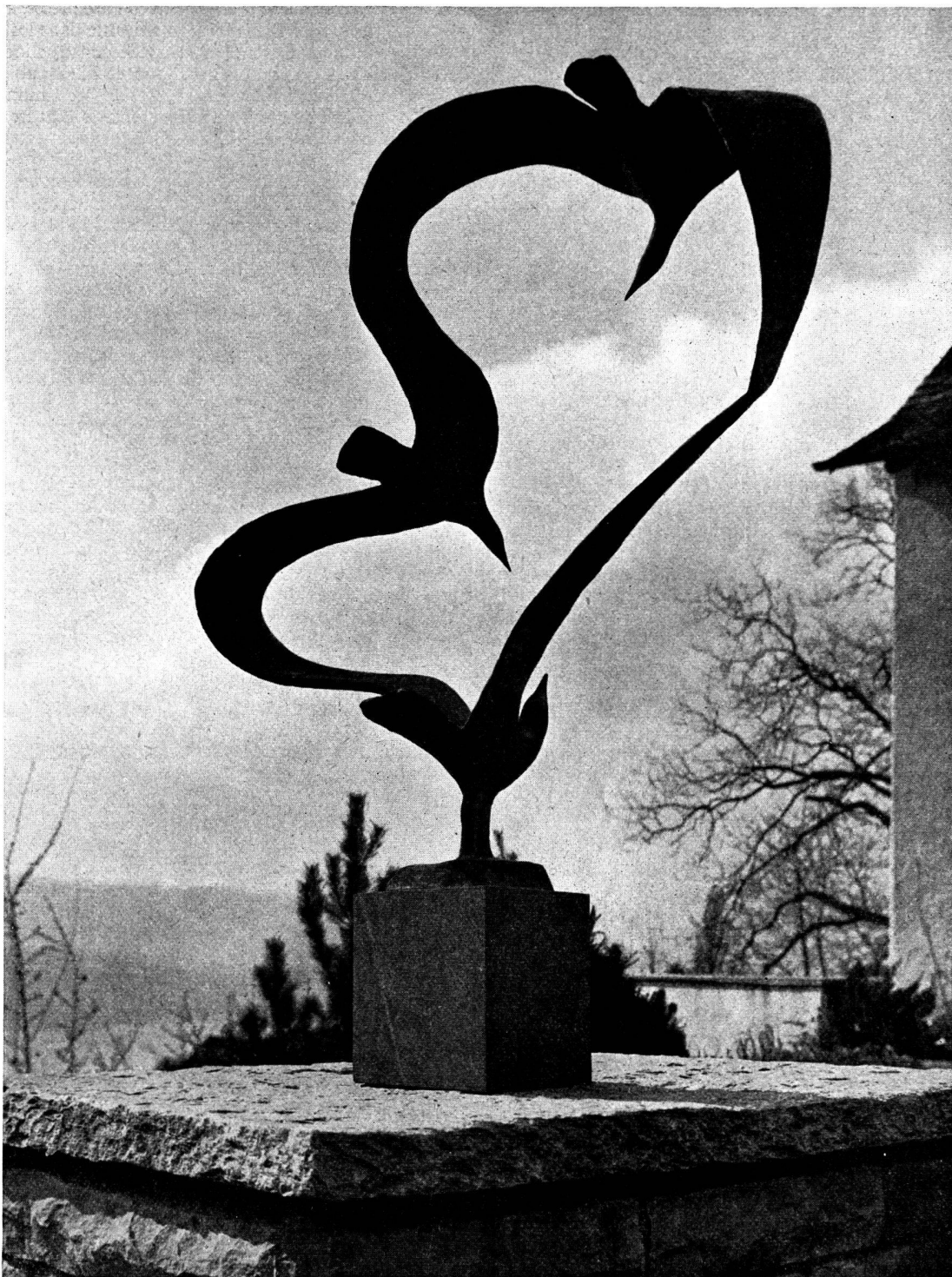
Sculpture en bronze d'Uli Schoop.

d'amateurs. Il faut reconnaître sans ambage que Zurich, Bâle, et dans une moindre mesure Berne, Lausanne et Genève ont fait beaucoup, ces dernières années, pour encourager les arts. On peut en dire autant des cantons du Tessin, de Schaffhouse et d'Argovie. En revanche, on peut déplorer certaines spéculations, ces tentatives de forcer artificiellement la cote de jeunes artistes à la «bourse» des arts plastiques. Cette atmosphère de serre chaude, peu bénéfique à l'art en général, est en quelque sorte une réaction face à la passivité qui règne ailleurs, dans les cantons et les communes qui négligent, bien qu'ils aient les moyens de le faire, toute possibilité d'encourager les beaux-arts. Depuis des années, on recommande aux