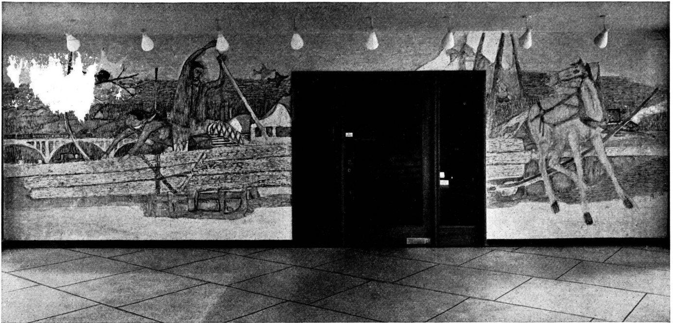
Peinture murale d'Aloys Carigiet, premier étage du bâtiment de l'Administration fédérale, à Berne.

dans le sens d'une économie resserrée, justifiée par les difficultés des années trente, où il fallait aller à l'essentiel, à la structure, à la surface pure de tout ornement, à l'utilité intégrale. Ces années et ces difficultés sont aujourd'hui révolues, le style contemporain s'est enrichi de toutes les expériences de la couleur et de la forme libres; il ne fait d'ailleurs, en cela, qu'évoluer dans le sens où tous les styles ont historiquement évolué.