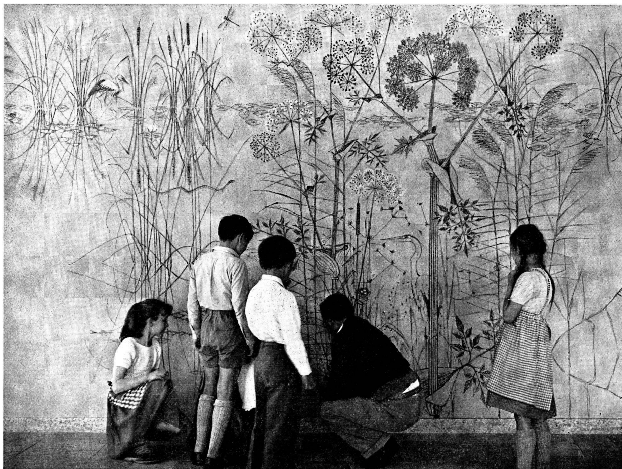
Peinture murale de Hans Fischer à l'école secondaire de Wiesendangen.

Mais comment accroître cet intérêt en phase de prospérité? Certes, l'exemple donné par les autorités fédérales, cantonales et communales qui décorent les locaux administratifs de bonnes toiles et de tapis muraux, les salles de réception de fresques ou de sculptures, qui veillent avec soin à la présen-