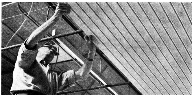
DAMPA lambris métalliques pour plafonds démontables. Pour l'acoustique et la ventilation

Profitez de nos services techniques pour trouver des solutions de vos problèmes dans les différents domaines de la lutte contre le bruit!