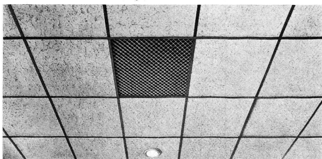
ULTRACOUSTIC dalle acoustique non perforée, incombustible, ici posée, sur rails visibles