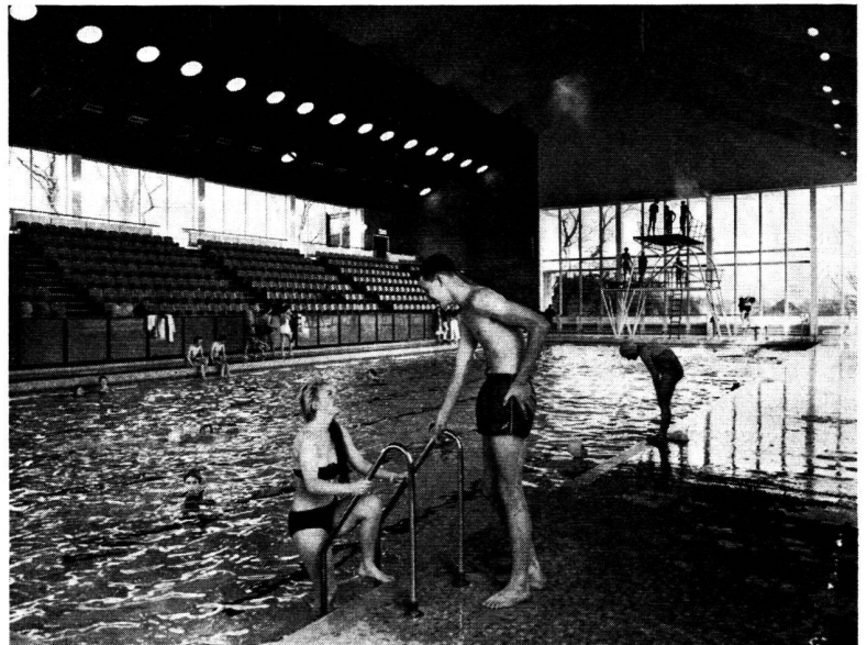
La piscine, une des attractions de la ville nouvelle de Harlow, Essex, Angleterre.