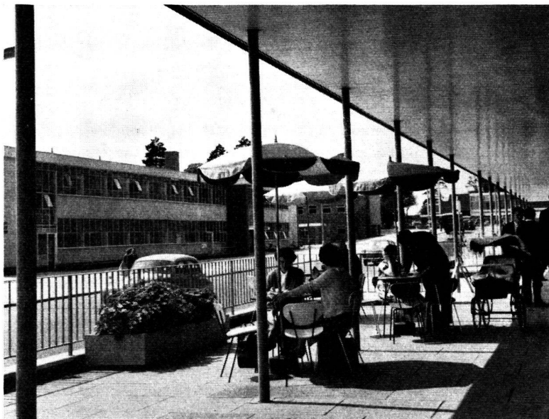
On peut prendre le café le matin à Stevenage, dans des conditions fort agréables. Stevenage est l'une des premières villes nouvelles de Grande-Bretagne.