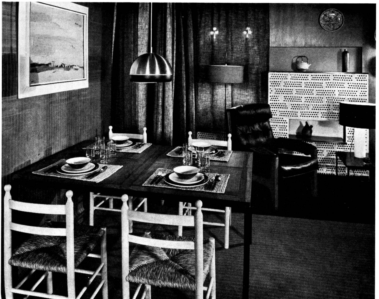
Table de Wieser. Chaises paillées portugaises. Décoration en briques de Maurice Blanc.

Mais on ignore en général un fait important. Il existe aujourd'hui des fauteuils, des chaises, des tables qui sont