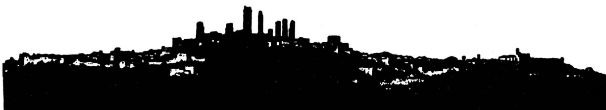
Silhouette de San Gimignano, Saarinen.

k) les dépôts de matériel et de matériaux usagés ainsi que des débris et des déchets domestiques, commerciaux ou industriels.